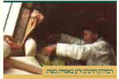
רבוה"ק הרמ"מ זי"ע באפיית מצות

כבר תמה הרדב"ז (ח"ג סי' תקמ"ו): מה נשתנה חמץ בפסח שהחמירה בו התורה יותר מבשאר איסורים? עובר עליו בבל-יראה ובל-ימצא, והוסיפו חכמים להצריכו בדיקה בחורין ובסדקין ולחפש אחריו ולשרש אותו מכל הגבולין, ואסרוהו בכל שהוא ואינו מתבטל כלל. ומאריך לפלפל בזה לבקש טעם עפ"י הפשט ובעמקי ההלכה, אך מפקפק ומגומגם בסברות שהעלה, וע"כ כתב כדברים האלה: