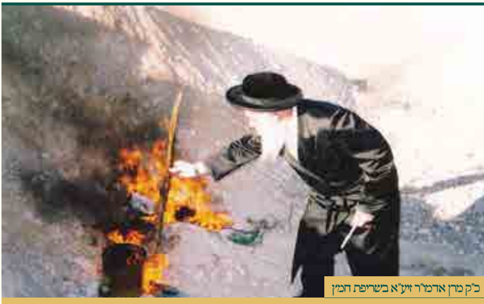
כ"ק מרן אדמו"ר זי"ע"א בשריפת החמץ

כי בני ישראל בגלות מצרים שקועים במ"ט שערי טומאה היו. וכאשר נצטוו מפי הגבורה להקריב הפסח, נשבר רוחם בקרבם כיצד מעובדי עבודה זרה ירהיבו עוז תיכף להקריב קרבן לה'?