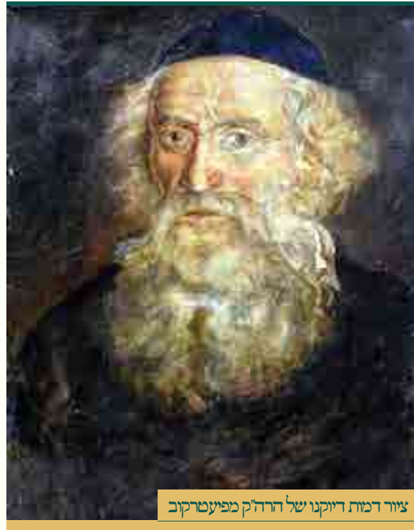
ציור דמות דיוקנו של הרה"ק מפיעטרקוב

קם ונסע לרבינו הק' ללעלוב. והוא החזירו לכור צור מחצבתו, עד שעלה ונתעלה בקדושה