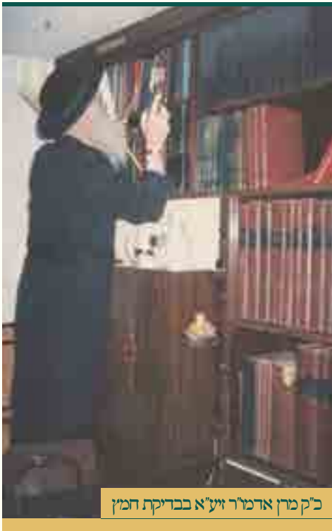
כ"ק מרן אדמו"ר זצ"ל בבדיקת חמץ

בתחילת שנת תרפ"ט הפליג רבינו הרש"ן בספינה למדינת צרפת אל עבר המרכז הרפואי הגדול בימים ההם שבעיר הבירה פריז. חודשים מספר שהה שם רבינו זי"ע, גדולי הרופאים ניסו להקל על ייסוריו עד כמה שידם מגעת. לנתחו ולרפאו כליל לא יכלו, בכך עשו לו נקב בגרונו וקיבעו שם צינורית אשר ממנה יהא ניזון הגוף הקדוש. בחודש האביב תרפ"ט שב רבינו לגבולו בנחלת אבות א"י, בשכבו על ערש דוי מלופף בייסורים של אהבה ומכאובים קשים ומרים.