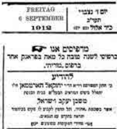
קטע מהעיתונות משנת תרע"א אודות רבי הארטמאן

בהילולא דרשב"י ביום ל"ג בעומר שנת תרע"א נסע לאתרא קדישא מירון, כאשר נפלה