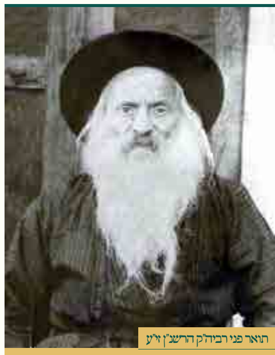
תואר פני רביה"ק הרשנ"ן ז"ע

ומענין לענין אגב גררא באותו ענין - מחומרותיו ודקדוקיו של רביה"ק הרשנ"ן ז"ע בענייני הפסח, כי החל מימי הפורים והילך עד ערבי פסחים לא