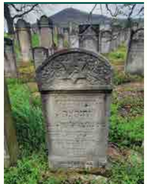
מצבת קברת רבי יחזקאל הארטמאן

אמנם, אחר מציאת קברה של הרבנית אין מי שיפקפק אחריה. כי זה הלשון אשר נחרט במצבתה בבית העלמין החדש שבמעז'בוז: פ"נ הרבנית המפורסמת מ' הינדא בת מ' יהודא, נכד הרב הצדיק מ' משה פשעווארסק, אשת הרב ר' יוסף משה, בהרב הצדיק אוהב ישראל מאפטא זלה"ה, כה תמוז תרכ"ח.