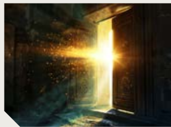
אָדָם שֶׁתְּמִיד יְכוֹל לְשַׁלֵּט עַל הַפֶּה שֶׁלוֹ, לְדַבֵּר רַק דְּבוּרִים טוֹבִים, הוּא חֵי חַיִּים נִפְלָאִים...

אָדָם שֶׁמְרַגֵּל אֶת עַצְמוֹ כִּי - חֵי חַיִּים טוֹבִים, וְלַעֲמַת זֹאת אָדָם שֶׁהוּא תְּמִיד מְמַרְמֵר, הוּא לְהַפְּךָ. כִּי "מִפְּיֹו דַעַת וּתְבוּנָה" - מְדַבֵּר הַפֶּה שֶׁל הָאָדָם אֶפְשָׁר לְהַפִּיר אִיפֹה הַמּוֹחַ שֶׁלוֹ. אָדָם שֶׁרַגֵּיל תְּמִיד לֹמַר רַק דְּבוּרִים טוֹבִים, אֲזִי הַמּוֹחַ שֶׁלוֹ בְּנֹדָאֵי בְּמִקּוֹם טוֹב. מִהַ שְׂאִין כּוֹן אָדָם הַרְגִיל לְהִתְאַנֵּן וּלְהִתְאוֹנֵן "אוֹי, הַמְּצַב קֶשֶׁה... נוֹ, בְּנֹדָאֵי עוֹד יֵהִי טוֹב... זֶה נִכּוֹן - בְּנֹדָאֵי יֵהִי טוֹב, אוֹלָם צְרִיךְ לֹמַר "עַכְשָׁיו טוֹב, וַיֵּהִי עוֹד יוֹתֵר טוֹב",