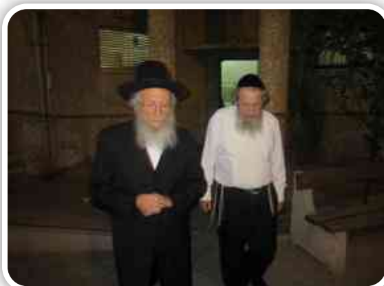
רבנו מלוח את מרן הגר"י ביציאה מביקור בביתו

בס"ד י"ט באייר תשע"א לפ"ק ל"ד למב"י הדר"ג דידי נפשי אלוף נעורי הגאון האדיר פאר ישראל מוהר"י אדלשטיין שליט"א רב אב"ד רמת השרון וקהלת נאות יוסף שלו' וברכה וכת"ס הנה ענותו תרבני לבא אלי בכתובים. אבל הרי כך היא דרכה של חכמי התורה האמתיים לדרוש בחכמה בכל אשר ימצא. [כל המכתב נדפס בס' בעקבי תודה ח"ב ס"ד]