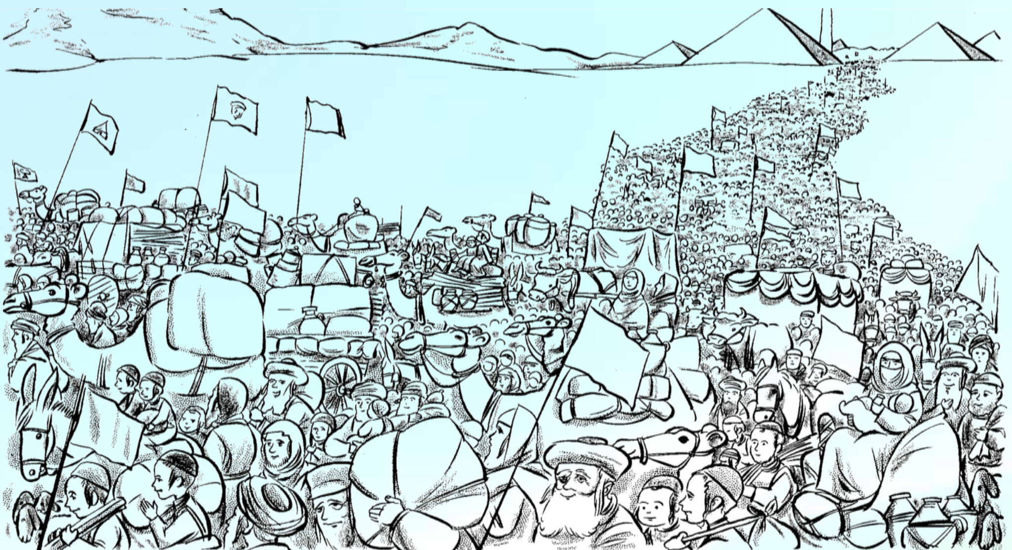
אסור לקרוא בזמן התפילה וקריאת התורה □ ניתן ללחוץ על שם המדור ולהגיע ליעד [במהדורה הדיגיטלית]

'מתיקות השבת' / הגר"ש לוינשטיין שליט"א (עמ' 12): ה'יה זה פשנזקק פעם לבדיקת דם. לאחר שהסתימה הבדיקה הבחין האח הרפואי שכמות הדם במבחנה אינה מספקת, וצריך עוד פעם להחדיר מחט ולהוציא כמות נוספת של דם. אמר האח: 'אעשה את הבדיקה במקום אחר'. אך רבנו אמר: 'לא לא, באותו מקום!' "אבל באותו מקום זה יכאב מאד?" תמה האח... 'שתולים בבית ה' / הגר"י פליסקין שליט"א (עמ' 16): מגיד שיעור בישיבה לצעירים הציעו לו סנדקאות, והדבר יהיה כרוך באיחור של 10 דקות לשיעור היומי בישיבה. אמר הגרמ"י ליפקוביץ זצ"ל, פשוט שאין לאחר את השיעור בשביל הסנדקאות... 'אוצר היסודות והחקירות' / יהושע לינטופ (עמ' 15): עיני קרבן פסח. המדורים: 'ביאורי תפילה' (עמ' 18) □ 'מחודדים בפיד' (עמ' 18) □ 'מרגליות שאול' (עמ' 19) □ 'דיבורים טובים' (עמ' 20)