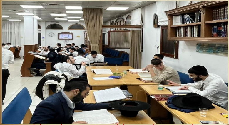
חלק מציבור הלומדים ב'ליל הישועות' פורים לתוך הלילה.

ניתן להתקשר לשאלה והתייעצות לטל' 052-7622517