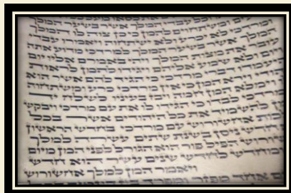
המגילת אסתר של רבינו מהר"ם זצוק"ל שעברה אל רבינו מהר"י זצוק"ל