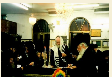
רבינו מהר"י זצוק"ל בקריאת המגילה אצל חותנו הרה"ק בעל ה"נחלת דן" ממודז'ץ זצוק"ל

הזה להיות נשפע לנבראים, הרי הוא עובר מערכה הנקראת 'סדר השתלשלות', וכך ההשפעה עוברת מעולם האצילות הגבוה ביותר לעולם היצירה ומשם לבריאה ומשום לעולם הזה הנקרא עולם העשיה, ובכל עולם ועולם ישנו השתלשלות של כל העשרה מידות, דהיינו בעולם האצילות יורד בהשתלשלות מכתר דאצילות, ועד מלכות דאצילות, ואז יורד ליצירה מכתר דיצירה ועד מלכות דיצירה, וכן הלאה עד עולם העשיה שיורדת מכתר דעשיה עד מלכות דעשיה, נמצא כי ההשתלשלות הנמוכה ביותר בשלשלת היא 'מלכות דעשיה'.