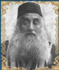
הרב יוסף הכהן כוג' יהנוף

כ"ה אדר תשל"ג (1973) היה הרב הראשי האחרון של בגדאד ובסוף ימיו אב"ד בירושלים, וחבר מועצת הרבנות הראשית ובית הדין הרבני הגדול.