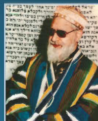
מרן רבינו עובדיה יוסף לבוש בגלימה בוכרית