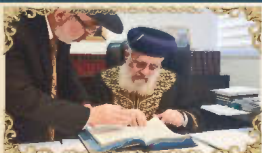
הראשון לציון והרה"ר ישראל רבינו יצחק יוסף שליט"א