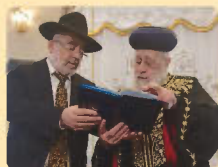
הראשון לציון הגאון הרב יצחק יוסף שליט"א מתפעל מהסידור המהודר עם מורנו רב הקהילה הרב שלמה זביחי שליט"א

מכון הוצאת הספרים וחקר כתבי יד של מוסדותנו "תפארת רפאל" שמח לבשר לרבני, גבאי ומתפללי בתי הכנסת, על הוצאת סידור התפילה השלם ליום שבת קודש ויום טוב בנוסח עדות המזרח. הסידור הודפס בפורמט גדול, ובאותיות גדולות, עם כל כללי הדקדוק למען ירוץ בו הקורא.