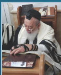
הראשל"צ רבינו שלמה עמאר בקריאת המגילה