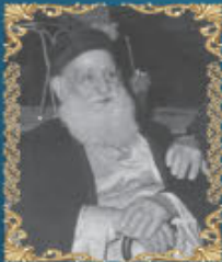
הרב מאיר ועקנין

"נר ה' נשמת אדם" - פטירת הצדיקים זצוק"ל בחודש אדר - "צדיקים במיתתן נקראו חיים"