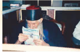
המקובל האלקי רבינו יצחק כדורי זצ"ל קורא את העלון 'תפארת רפאל' שהיה מגיע לידיו מידי שבת בשבתו