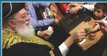
הראשון לציון ורבה של ירושלים רבינו שלמה עמאר שליט"א בחלוקת 'דמי פורים'