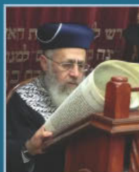
הראשל"צ רבינו יצחק יוסף בקריאת המגילה