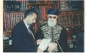
הראשון לציון מרו רבינו עובדיה יוסף זצ"ל עם מייסד העלון הרב שלמה זביחי שליט"א המגיש לפניו את עלון מספר 500