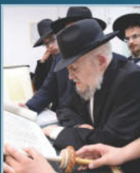
הגאון רבינו מאיר מאוזז בקריאת המגילה