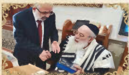
הראשון לציון ורה"ר ש"ר יוסף שליט"א רבינו שלמה עמאר שליט"א