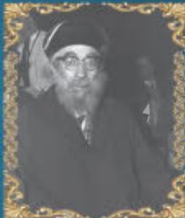
הרב יצחק אביחצירא

כ"ז אדר תשל"ט (1979) היה דיין ומקובל, אב בית דין מחוז שרעב וסינואן שבתים, ומגדולי רבני עולי תימן. נטמן בבית העלמין ביהוד.