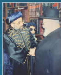
מרן רבינו עובדיה יוסף עם הרב שלמה זבחי