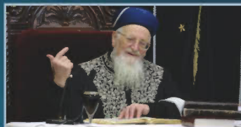
הראשון לציון רבינו מרדכי אליהו זצ"ל במסירת שיעורו הקבוע בהלכות חג פורים