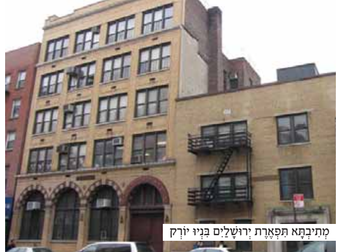
מתיבתא תפארת ירושלים בניו יורק

למחרת שבנו, אני והחולה, לביתו של הרב. בני הבית זהו אותנו ומיד נתנו לנו להכנס. עם כניסתנו הרים הרב את ראשו מספרי ופסק בחדות: 'צריך לנתח!' אחר הביט אל תלמידו והבטיח: 'אשתדל להתפלל ולהתחנן בעבורך לרחמי שמים, שתזכה להאריך ימים בטוב ובנעימים'.