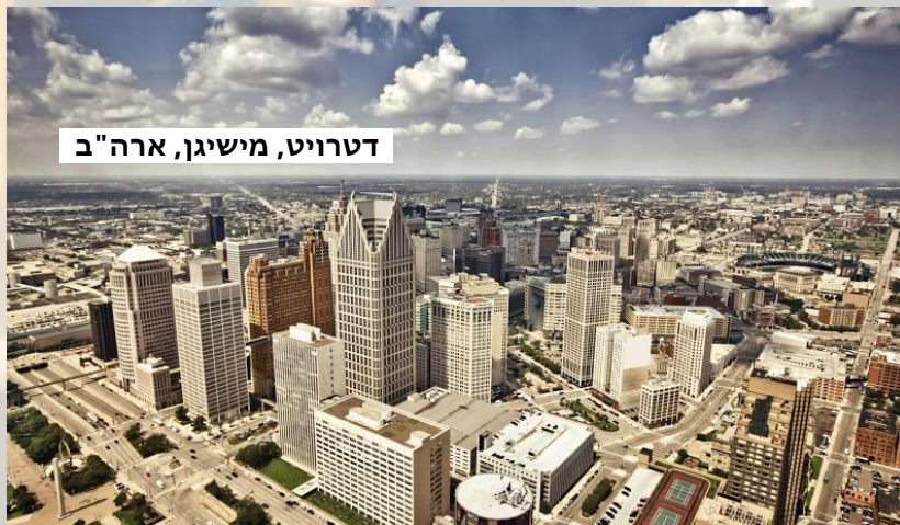
דטרויט, מישיגן, ארה"ב

המום ונסער, כשכולו שברון לב ומפח נפש, דמעות חונקות את גרונו על מנת להשפלה שספג על לא עוול בכפו, יצא ר' צבי אלימלך מבית הכנסת, כשאינו מסוגל להבין להיכן נקלע בשעה האחרונה, מהו בית הכנסת הזה, מי הם מתפלליו? מה פשר