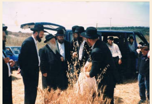
הרב זצ"ל בקיום מצוות מתנות כהונה

עוד בשנים צעירות, אבה הרב לקיים מצות לקט שכחה ופאה, וכה כתב בקונטרס הזכרונות: ירקות בחצר ואמר לי [החזו"א] להרחיק טפח ומחצה בין מין לחברו, הדברים מעלים תמיהה, ממותי עסק הרב בנטיעת