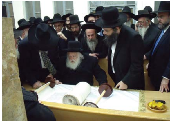
הרב זצ"ל בקריאת ספרי התהילים מתוך קלף

הנה אנחנו ראינו כמה וכמה מצות שעושים בנ"א ואינם מתקיימים דברי רבותינו ח"ו בענין גודל שכרם אפי' בעוה"ז, אבל השרש שהכל נשען עליו הוא שבעשיית המצוה אל יחשוב שהיא עליו כמשא וממחר להסירם מעליו אבל יחשוב בשכלו כאילו בעשותו אותה המצוה ירויח אלף אלפים דינרי זהב, ויהי' שמח בעשותו אותה המצוה בשמחה שאין לה קץ מלב ונפש ובחשק גדול כאילו ממש בפועל נותנים לו אלף אלפים דינרי זהב אם יעשה אותה מצוה, וזהו סוד הפסוק תחת אשר לא עבדת את ה' אלקיך בשמחה ובטוב לבב,