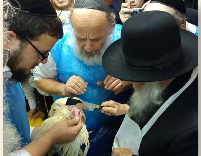
הרב זצ"ל בשחיטה