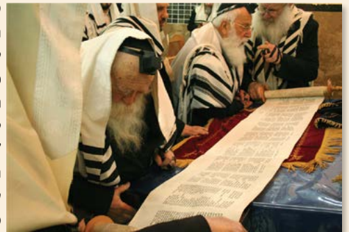
הרב זצ"ל בקריאת ספר תהילים מתוך קליף

שנים רבות עמל הרב, וקיבץ פרוטה לפרוטה, בכדי לקיים מצות כתיבת ספר תורה פרטי בכדי לקיים את מצות 'ועתה כתבו לכם', הכתיבה התפרסת ע"פ כמה שנים, כאשר רק הרב והרבנית ע"ה, יודעים על הדבר, ממש לפני