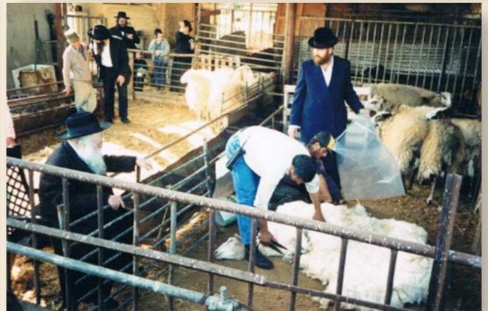
הרב זצ"ל בקיום מצוות ראשית הגז