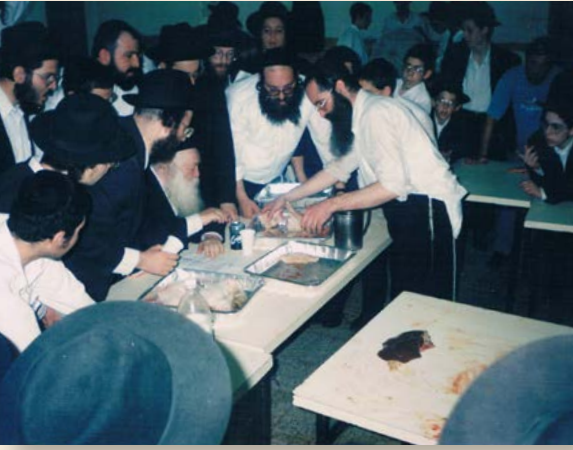
הרב זצ"ל בקיום מצוות מתנות כהונה