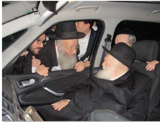
רבינו זיע"א בניחום אבלים אצל 'ידלטי'א הגר"א דינר שליט"א

ולכן כל מה שהיה להרב זה רק התורה, וידוע שמרן הסטייפלר אמר לבנו של הרב, הגרא"ש שליט"א, שכל ספק שיש לו שישאל את אביו כיון שכל מה שהוא אומר מגיע מהתורה, שאין אצלו שום דבר אחר חוץ מתורה.