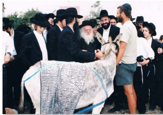
הרב זצ"ל בקיום מצוות פדיון פטר חמור

ליקוטים מתורת הרב זצוק"ל בענייני שמחה של מצווה