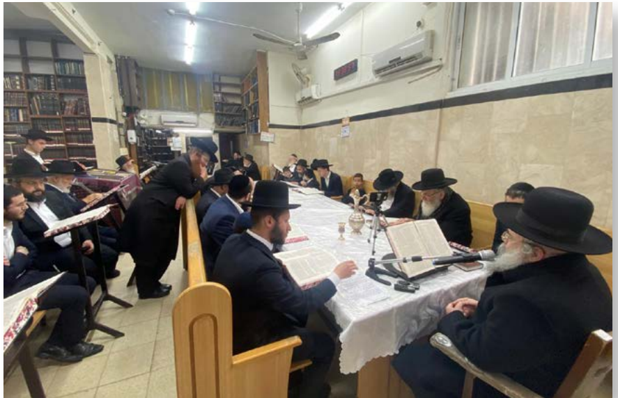
סיום מסכת שקלים

מעמד סיום מסכת שקלים מהירושלמי התקיים במסגרת השיעור היומי הקבוע בבית המדרש 'לדרמן' לעילוי נשמת הרב זצוק"ל, הנמסר ע"י בנו הגרי"ש קניבסקי שליט"א מידי יום לאחר תפילת מנחה בבית שני בבית המדרש לדרמן בשעה 13:10. לאחר הסיום החל הלימוד במסכת יומא.