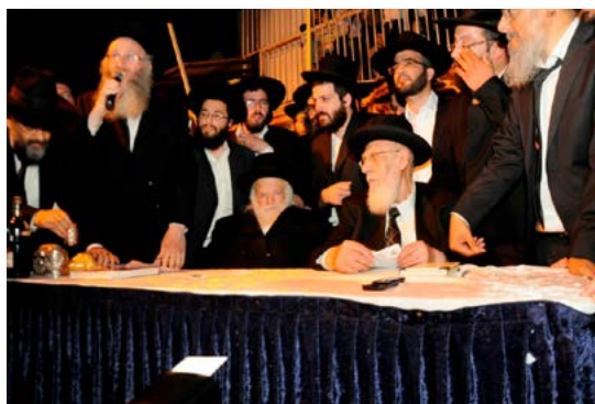
הגרי"א דינר שליט"א נושא דברים במעמד פידיון פטר חמור במחיצת רבינו זיע"א

יש יהודי בגייטסהד שסיפר לי, שהוא שלח לפני למעלה מארבעים שנה שאלה להרב, ובתוך המעטפה הוא הניח מעטפה נוספת ודף ריק כדי להחזיר בזה את התשובה והניח שם גם דולר לשלם על הבול, ולאחר כחודש הוא קיבל את התשובה בדואר אוויר שזה דף בודד ללא מעטפה, המעטפה נשארה אצל הרב, והנה לאחר זמן, הגיע אליו שליח מהארץ שהרב מחזיר לו את המעטפה והדף הריק שהוא שלח אליו, וזה מבחיל שהרי כל מה שהרב היה עונה תשובות לאנשים זה כדי לחזק אותם ולשמח אותם, ועדיין הוא שם לב שלא ישאר אצלו ח"ו דבר שלא שייך לו, מפאת חשש גזל.