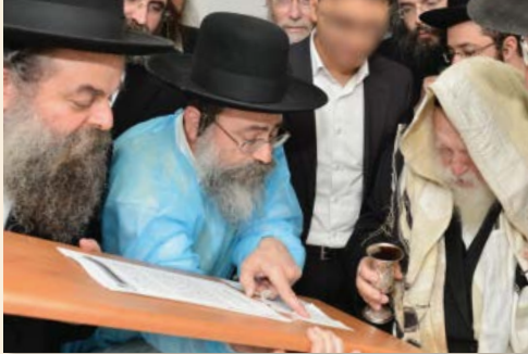
הרב זצ"ל מברך את הברכות לאחר מילת נר

אמרו חז"ל (שבת ק"ל א) 'כל מצוה שקיבלו עליהם בשמחה כגון מילה דכתיב שש אנכי על אמרתך כמוצא שלל רב עדיין עושין אותה בשמחה', הרב שאף מאד לקיים מצוה זו, אך 'חכם לב יקח מצוות' - ביקש הרב לקיים מצות