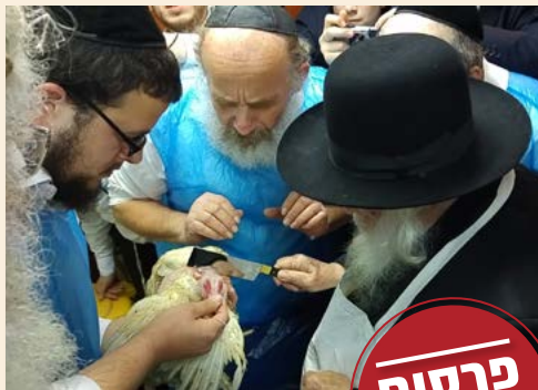
הרב זצ"ל בשחיטה