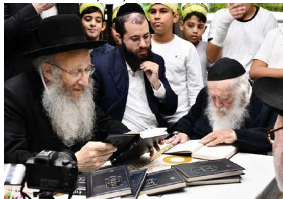
במעמד התלחת לימוד הלכות שביעית לאלפי ילדי הקיבוץ

ידוע שאצל הרב ראו בחוש - דבר ה' בפיו - פעם היה גביר שהיה תורם סכומים עצומים לצדקה, שנה אחת לביל פורים הוא תרם ארבע מליון דולר לצדקה, ויומים לאחר מכן הוא נהרג בתאונת דרכים, ובאו לפני הרב לשאול אותו איך אפשר לנחם את האלמנה, והרי גם כתוב 'צדקה תציל ממוות', והרב ענה שאותו גביר היה צריך ללכת מהעולם לפני עשרים שנה, ורק בזכות מצות הצדקה הוא נשאר בחיים, וכשסיפרו את זה לאלמנה היא אמרה, שעכשיו היא נזכרת שלפני עשרים שנה בעלה עבר תאונה גדולה והוא יצא ממנה בניסי ניסים, ונמצאו דברי הרב מדוייקים ביותר.