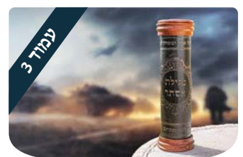
עמוד 3 הרב משה לנדאו גיהנום שהוא גן עדן