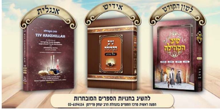
להשיג בחנויות הספרים המובחרות

טיב אוצרו של הרה"ק רבי נסליאל הכהן רבינוביץ שליט"א