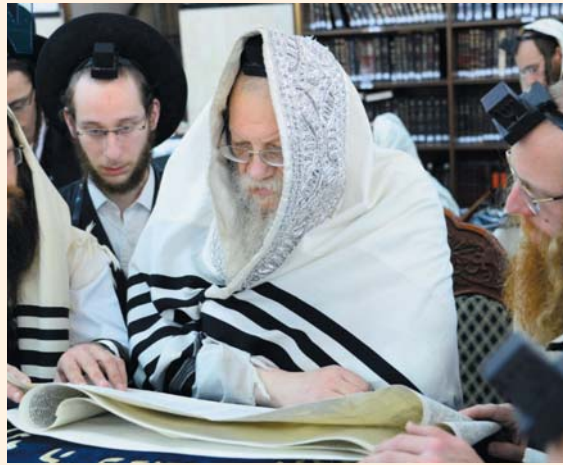
כ"ק האדמו"ר ממודיץ שליט"א בקריאת מגילה

עברה תקופה, ואת המדינה פקדה בצורת קשה. חורף אחד עבר, וגשם איץ. גם בחורף השני נשארו השמים נעולים, וכך גם בשלישי. השייח מצא כאן הזדמנות להיפרע מהיהודים, שנואי-נפשו. את דרשותיו במסגד כיוון לעבר היהודים, והאשימם בבצורת הקשה. יום שישי אחד, לאחר נאום-הסתה חריף ביותר, התרכז סביבו המון מוסת, והשייח קרא: "בוא אחרי אל מרדכי היהודי, שבגללו נעצר הגשם, כי הרי מפתחות הגשם הם בידי היהודים". בליווי ההמון הפרוע, עשה איברהים את דרכו