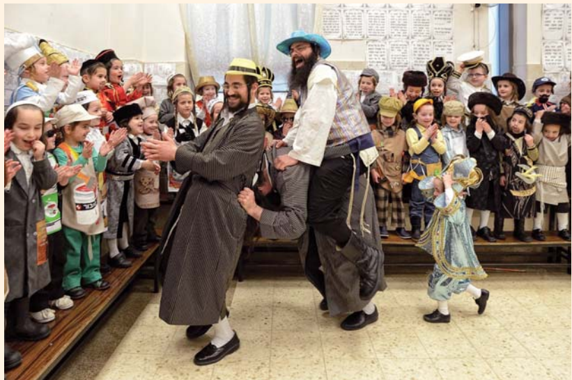
שמחת פורים בתלמוד תורה "תולדות אהרן"