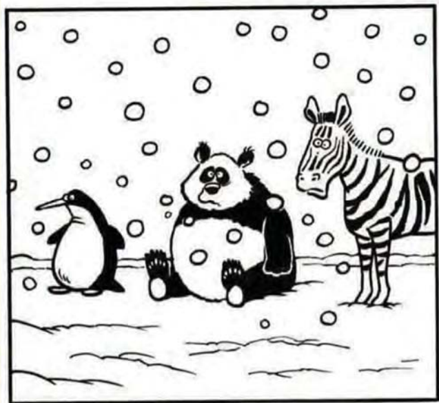
חוברת צביעה לעצלנים

כל מילה ומילה של לימוד תורה הינה מצוה בפני עצמה!