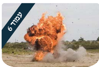
עמוד 6 הניצוץ היהודי פיצוץ רוחני