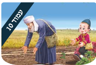
עמוד 10 ערכים לילדים לקראת שבת-מדור חדש

המן מתואר כצורך, כאכזר - אך לא כשוטה. אדרבא, התנהלותו המחושבת מעידה על פיקחות שטנית