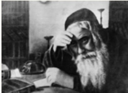
רבינו בימי חורפו בתקופת רבנותו בהינטשטש שבסבריה

"בשעה שמכניסין אדם לדין אומרים לו נשאת ונתת באמונה, קבעת עינים לתורה? הביא קושיית בעלי התוספות בסנהדרין ז' ע"א הלא הגמרא אומרת 'תחלת דינו של אדם אינו אלא על דברי תורה' ומדוע כאן שואלים תחלה 'נשאת ונתת באמונה?' אלא לכל אדם כשכא לעולם העליון אחרי מותו יש לו תירוץ מוכן על השאלה אם הוא עסק בתורה: הוא היה צריך לפרנס את אשתו וילדיו ולא היה לו פנאי לעסוק בתורה ולכן שואלין אותו 'נשאת ונתת' על כל פנים 'באמונה' לתפוס לפחות מעט 'אמונת התורה' כפי היכולת ויהיה חולין על תורת הקודש.