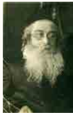
בנו הגדול הרה"ק רבי אלתר ישראל שמעון מנובומינסק זי"ע בעל "תפארת איש"

בשנים אלו המו דרכי נוואמינסק בהמון רב שהיו מרבים ובאים ברכבות ובעגלות לשחר פניו, רבינו שהתפרסם לאיש מופת ופועל ישועות.