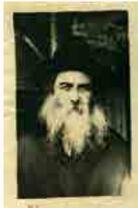
בנו הגדול הרה"ק רבי שלמה חיים פרלוב מבולחוב זי"ע הי"ד בעל "מקדש שלמה" על תהלים