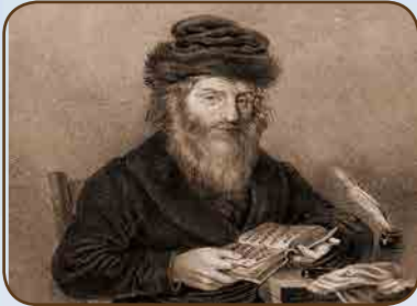
מנן רבינו ה'חתם סופר' זיע"א

אשתו השנייה של הגה"ק רבנו בעל ה'חתם סופר' זיע"א, הייתה הרבנית הצדקנית מרת שרה סריל סופר עליה השלום, בתו של הגה"ק רבנו עקיבא איגר זיע"א. עוד בצעירותה היא פתחה צנאה לבניה