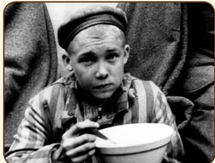
נער יהודי אוכל בזמן שחרור המחנה

עם הכנס הצבא הנאצי אל העירה אלכסנדר, הסמוכה לעיר לודז' שבפולין, התחילו בפרעות וחלול הקדש, בדמות שרפה ובזי ספרי תורה ותשמישי קדש. בחדש אלול של שנת ת"ש שרפו את בית הכנסת ובית המדרש של העירה. באותו היום אך אטפו מספר רב של ספרי תורה והוציאו אותם לשוק, שם הציתו מדורה ושרפו בה את כתבי הקדש.