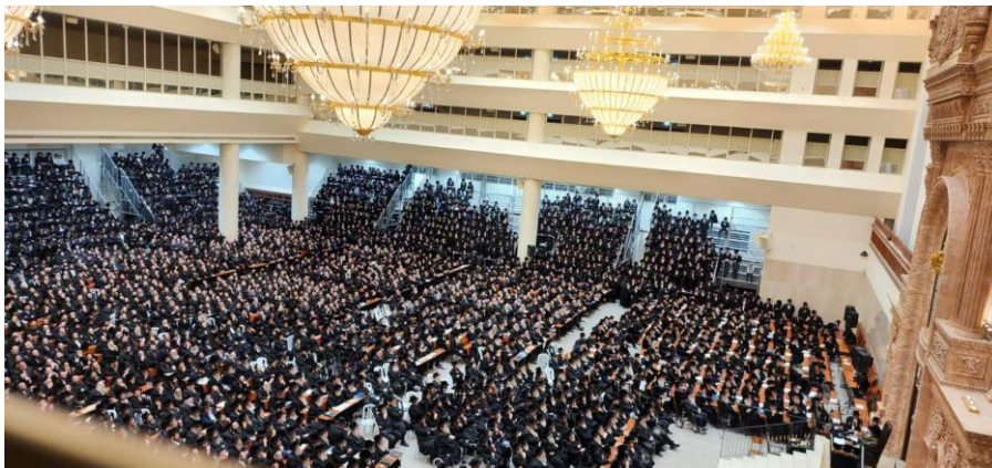
הכינוס הגדול בבית המדרש הגדול דחסידי ויז'ניץ בכ"ח טבת תשפ"ד. על פי הוראת מרן האדמו"ר שליט"א, כל הבניה נעשתה על ידי יהודים שומרי תורה ומצוות.