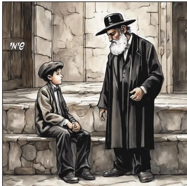
הרבי ראה את הילד העצוב היושב לו לבד בקרן זוית, ניגש הרבי אל הילד ושאל אותו מה קרה היום?

הרע"ב מביא את מה שכתב הרמב"ם מ"אבות דרבי נתן" ומוסיף: "פירשו באבות דרבי נתן, כיצד היה אהרן אוהב שלום, כשהיה רואה שני בני אדם מתקוטטים היה הולך לכל אחד מהם שלא מדעת חברו ואומר לו, ראה חברך איך הוא מתחרט ומכה את עצמו על שחטא לך והוא אמר לי שאבא אליך שתמחל לו, ומתוך כך כשהיו פוגעים זה בזה היו מנשקים זה את זה. וכיצד היה מקרב את הבריות לתורה, כשהיה יודע באדם שעבר עבירה היה מתחבר עמו ומראה לו פנים צהובות, והיה אותו אדם