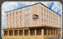
תמלון חדרי אירוח אלום הכנסת אורחים

שילחו קוויטל לצדיק לברכה וישועה בכל הענינים