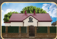
בית רבינו מקוה נהרה - בית הכנסת קאווע שביבל