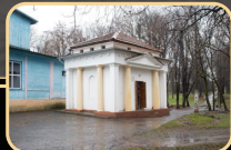
הציון הקדוש על הקדוש הזה הוא ממש כמו שעומדים לפני בחיים חיותו