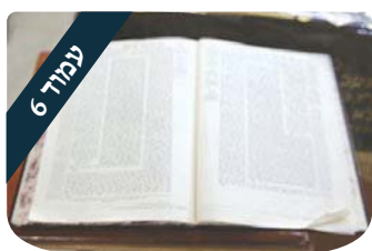
הניצוץ היהודי להדליק את האור