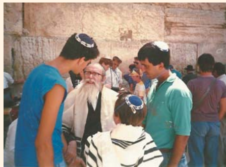
מקרב כהרגלו בקודש מידי יום ביומו יהודים ליד הכותל המערבי

זכור לי, כי פעם אחת כאשר הרבנית ע"ה שכבה על ערש דוי, וסכנה אמיתית נשקפה לחייה, הגיע לפתע יהודי מסוים, כדי לדבר עם הרב על ענייניו הפרטיים. בטוח הייתי, כי הרב יסביר לו בעדינות, שכעת אין לו זמן ושלוות נפש לדבר עימו. אבל זה לא קרה. הרב ישב איתו והקשיב לו בסבלנות גדולה, בה בשעה שליבו מלא היה דאגה וכאב על מצבה של אשתו. לאחר שעה קלה יצא היהודי מבית הרב, כשחיוך נסוך על שפתיו, הוא לא הרגיש כלל את סערת לבו ונפשו של הרב לנוכח מצב אשתו. בצאתו שאלתי את הרב בתמיהה: "מדוע לא הסביר הרב ליהודי כי עכשיו הזמן לא מתאים לשיחה, בגלל מצבה של הרבנית?" "השיב לי הרב: "להפך, דוקא בזכות זו שדיברתי ועודדתי אותו, יחיש ה' רפואה שלימה עבורה".