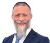
הרב מיכאל לסרי