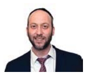
הרב ישי וליס