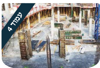
הרב דניאל נשיא יסודות האדם