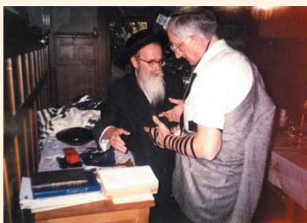
תמונה זאת שנראה בה המשפיע מניח תפילין ליהודי, צולמה על ידי בעיר פיסטבורג שבארצה"ב. היה זה בעקבות כך שבעל תשובה התחתן עם גיורת וביקש מאיתנו שנגיע לחתונתו.

זכור לי, כי פעם בנסיעה איתו במכונת, לפתע היא נעצרה ולא יכלה להמשיך בנסיעה.