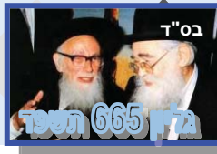
בס"ד גזן 665 תשפ"ד

ה'תשפ"ד תשרי 5:04 ה'תשפ"ד תשרי 6:12 ה'תשפ"ד תשרי 6:48