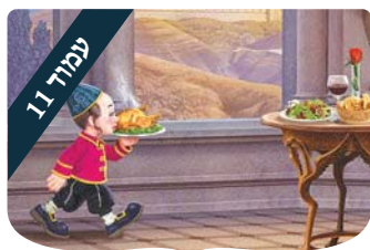
ערכים לילדים מצא את ההבדלים

כשמטפסים על ההר באמצעות צעידי עקבית של דף ליום, ניתן לכבוש אותו בפרק זמן של שבע וחצי שנים.