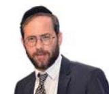
הרב משה לנדא