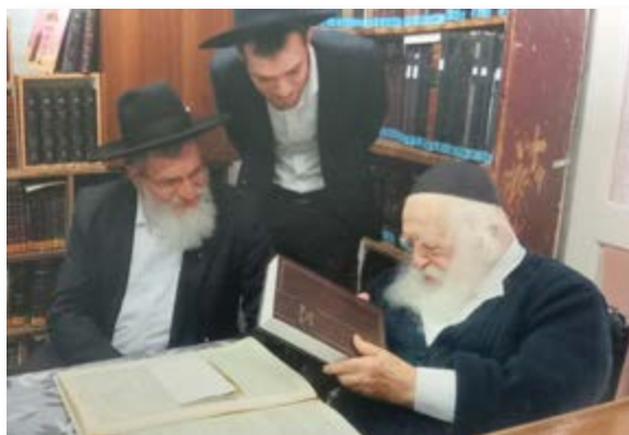
אביו של הגר"מ ערבה שליט"א עם הרב זצוק"ל

ורבינו הקשה שהרי גם אותיות ג-ק ואותיות ז-ט וז-צ וס-צ אינם מופיעות ביחד, ותיקן שג-ט הם האותיות הראשונות שאינם יחד בתורה, והעזתי פני ושאלתי מהיכן ידע דבר זה (והדגשתי לפניו שניחא אם אליהו זכור לטוב אמר לו נקבל או להבדיל אם זה היה מתברר ע"י בדיקת מחשב, אבל ללא זאת איך אפשר לזכור בכל התנ"ך איזה אותיות יש בלי לעבור פסוק פסוק) וענה לי שהוא 'הרגיש' שאין את האותיות הללו ברצף אלו, כמו כן ניתן לומר גם לגבי אותם 48 הפסוקים, שהרגשתו היתה גם על אות של תחילת פסוק וסיום פסוק, כי הרי בלי הסבר זה, הרי