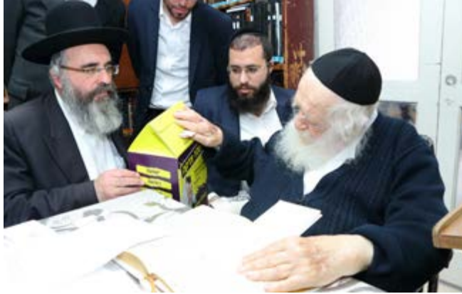
הרב זצוק"ל בעת נתינת צדקה לקופות הצדקה בארץ ובעולם

(יט) משפחה שתורמו להם כסף ואמרו להם מפני כבודם שזה הלואה וכעת מתעקשים להחזיר מותר לקבלו ולשמרו לצורך מטרה אחרת באותה משפחה (הנ"ל, וע"י רמב"ם פ"ז ממתנ"ע ה"ט ומשכ"ט ב"ד א"א סק"ה).