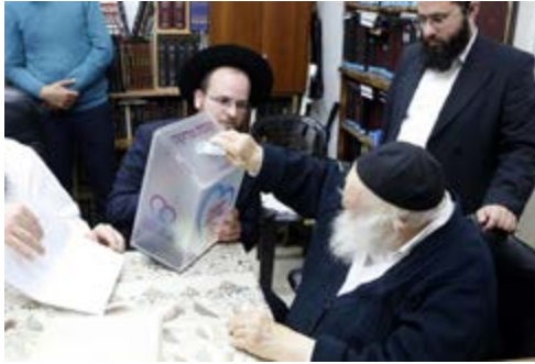
הרב צוק"ל בעת נתינת צדקה לקופות הצדקה בארץ וביעולם

• פסק לי מו"ר (שליט"א) צוק"ל דמי שנותן סכום כסף לקנות דירה או שאר צרכי חתונה לבנו הלומד בישיבה אינו צריך להפריש מעשר מהסכום הזה כי כל הסכום הזה הוא צדקה שנותן לבנו ומ"מ אמר מו"ר שיתן האב מהסכום הזה סכום לא גדול לעניים, והוסיף מו"ר הא דמובא בפוסקים שהאב מעשר את מעות הנדוניא שמכניס לזוג (עי' בשר"ת שאילת הגיעב"ץ ז"ל ח"א סי' ו' הובא בפ"ת סי' רמ"ט ס"ק א') שם מייירי מחיוב המעשר שחל על הזוג שקבלו את כסף הנדוניא ובכה"ג אמרו שהאב משאיר לעצמו את הזכות לתת