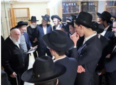
צניגי הישיבות מתברכים עי מרן הגר"י זלברשטיין שליט"א לקראת פתיחת תוכנית 'מדובבי שיח'

מכתב חיזוק מיוחד שנשלח ע"י מרן ראש הישיבה הגרבי"ד פוברסקי שליט"א לתלמידי הישיבות מכל רחבי הארץ, בו הוא מחזק את ידם לרגל פתיחת המחזור החדש ללימוד 'ארחות ישר' ספרו של הרב זצוק"ל, במכתבו כתב מרן הגרבי"ד שליט"א: 'ןעתה כשמבקשים לחזק לימוד המוסר בספר ארחות ישר למרן שר התורה הגר"ח קניבסקי זצוק"ל שכתב ספרו לצורך הדור והחיזוק, וזאת יתירה היא הקביעות בספר הזה, וההתחזקות בלימוד המוסר הרפוי ביידיש, וחוסים בחיזוק בזה לשיטתא רשטיא יתירה, ויתברכו המתאמצים בזה להתגדל בתורה לגאון ולתפארת.'