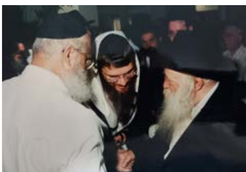
הרב זצוק"ל בעת שמחת הברית לבנו של הר"מ ערבה שליט"א

לאחר הבר מצוה שלחתי לרבינו מכתב שאני רוצה ללמוד איתו, הוא ענה לי שאכנס אליו, נכנסתי ואמרתי לו שאני רוצה ללמוד איתו, הוא ענה לי שאין לו זמן, שאלתי אותו, א"כ כיצד הלל ענה על שאלות מטופשות למה עיניהם של תרמודיין תרוטות וכד' (עי' שבת ל"א א'), ורבינו השיב שהלל אחז ש'זה הרמה של מי ששואל אותו, וצריך לתת לכל אחד את החשיבות לפי הרמה שלו, ועולם חסד יבנה', התחלתי להסביר לרבינו, שאבי חוזר בתשובה, ואני לומד בישיבה, וכל אחד יש לו מנהגי אבותיו, ואני עומד נכון שאיני יודע מה לעשות