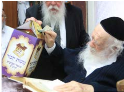
הרב זצוק"ל בנתינת צדקה לקופת העיר