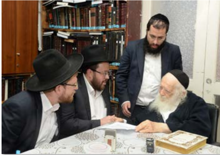
הרב זצוק"ל בהכרעה לגבי קופת 'שוב וחסד' אלעד

כתב הרמב"ם (פ"ג מהל' ת"ת הי"י): 'כל המשים על לבו שיעסק בתורה ולא יעשה מלאכה ויתפרנס מן הצדקה הרי זה חלל את השם ובזה את התורה וכבה מאור הדת וגרם רעה לעצמו ונטל חייו מן העולם הבא. לפי שאסור להנות מדברי תורה בעולם הזה. אמרו חכמים 'כל הנהנה מדברי תורה נטל חייו מן העולם'. ועוד צוו ואמרו 'אל תעשם עטרה להתגדל בהן ולא קרדם לחפר בהן'. ועוד צוו ואמרו 'אהב את המלאכה ושנא את הרבנות', 'וכל תורה שאין עמה מלאכה סופה בטלה וגוררת עון'. וסוף אדם זה שיהא מלסטם את הבריות'