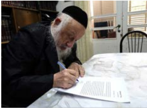
מרן ראש הישיבה הגרבי"ד פוברסקי שליט"א כותב את מכתב החיזוק לקראת פתיחת תוכנית 'מדובבי שיח'