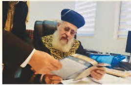
הראשון לציון רבינו יצחק יוסף שליט"א נותן את עצמו הדרכתו וברכתו לרצות עלון מספר 1,800

היוצא לאור משנת תשמ"ה (1985) מידי שבוע בעשרות אלפי עותקים ומחולק בכל רחבי הארץ ולקהילות בחו"ל. גדולי ישראל סמכו ידיהם על עלון זה שמפיץ את תורת רבני ספרד והמזרח ומנחיל את מורשת יהדות ספרד המפוארה יחד עם הלכות וזמנים ממרח רבינו עובדיה יוסף זצוק"ל