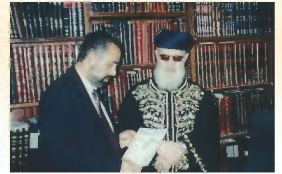
הראשון לציון מו"ר רבינו עובדיה יוסף זצ"ל עם מייסד העלון הרב שלמה זביחי שליט"א המגיש לפניו את עלון מספר 500