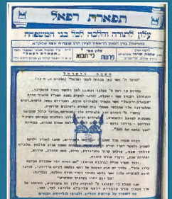
עלון מס' 1