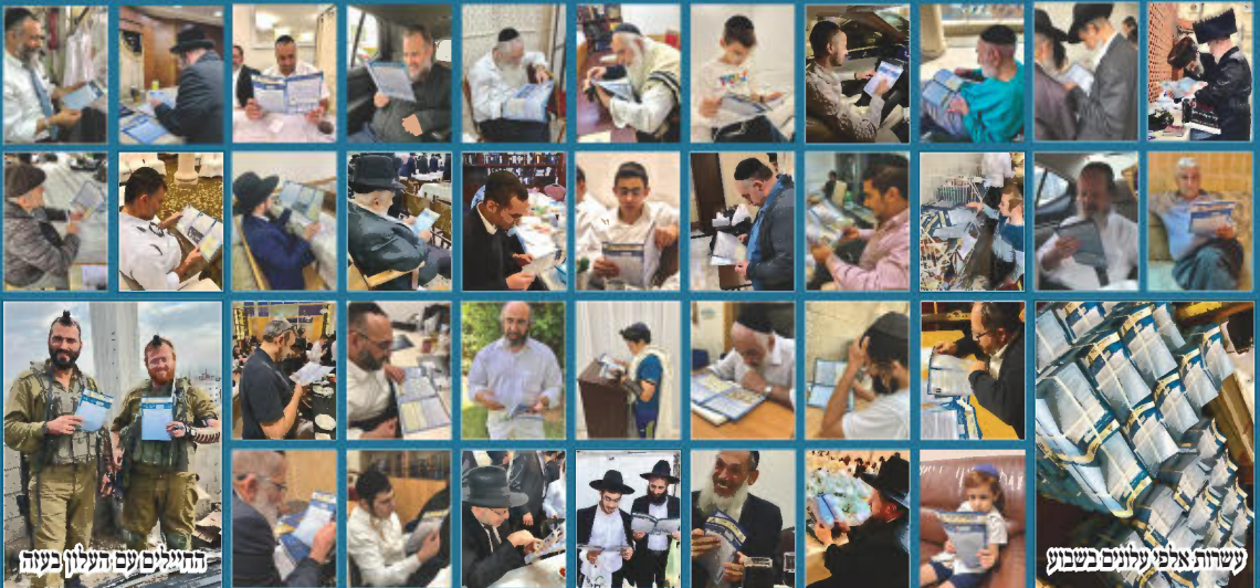
התעלים עש העלון בעזה