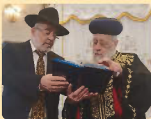
הראשון לציון הגאון הרב יצחק יוסף שליט"א מתפעל מהסידור המהודר עם מורנו רב הקהילה הרב שלמה זביחי שליט"א

מכון הוצאת הספרים וחקר כתבי יד של מוסדותנו "תפארת רפאל" שמח לבשר לרבני, גבאי ומתפללי בתי הכנסת, על הוצאת סידור התפילה השלם ליום שבת קודש ויום טוב בנוסח עדות המזרח. הסידור הודפס בפורמט גדול, ובאותיות גדולות, עם כל כלי הדקדוק למען ירוץ בו הקורא. נוסח הסידור מתוקן ומונה בדקדוק רב, על פי נוסחאותיו המדויקות של מאור ישראל הראשון לציון הגאון הגדול מרן רבנו עובדיה יוסף זצוק"ל. למען רומם בית אלוקינו ולכבד את שבת הקודש ויום טוב, הסידור הודפס על נייר קרם "בייבל" משובח, כמו כן כריכת הסידור הינה מפוארת מאוד, דפי הסידור צבועים בצדדיהם בצבע תכלת, וסימניה חזקה עבה ויוקרתי מעטרת אותו.