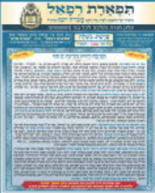
עלון מס' 2000

תמונות גדולי ישראל ועמך ישראל בקריאת עלון 'תפארת רפאל'