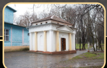
הציון הקדוש על הציון הקדוש הזה הוא ממש כמו שעומדים לפני בחיים חיותו