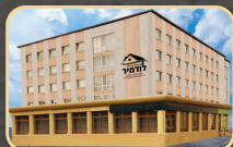
תמלון חדרי אירוח אלום הכנסת אורחים

שילחו קוויטל לצדיק לברכה וישועה בכל העניינים