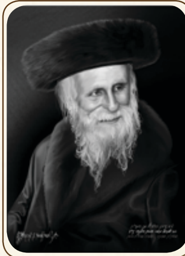
ציור רבינו זע"א וחתמתו

מרן מהרש"ם הכהן מאמסנא זצוק"ל 59 שנים לפטירתו - ט"ז בטבת תשכ"ה