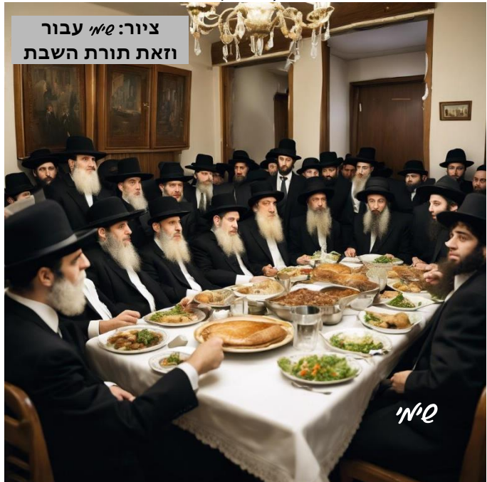
ציור: א"ה עבון וזאת תורת השבת

מיד נזכרתי. 'אה, בטח שאני זוכר'. 'מה שלומך?' שאלתי. 'תשמע כבוד הרב, אני חייב לספר לך מה קרה מיד אחרי שנפרדנו, אמר