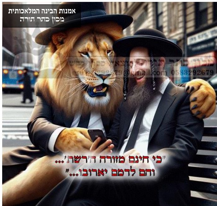
אמנות הבינה המלאכותית מכין כתר תורה

על זאת שאל את המלאך, שאך ענה לו: וַיֵּצֵן וַיֹּאמֶר אֵלַי, לְאָמֹר, זֶה דָּבָר-ד', אֵל זָרְבָבֶל לְאָמֹר: לֹא בָחֹל, וְלֹא בְכֹחַ כִּי אִם-בְּרוּחִי, אָמַר ד' צְפָאוֹת. (זכריה ד ט)