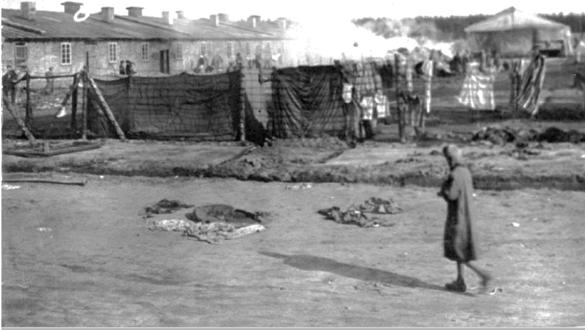
מחנה ברגן בלזן לאחר השחרור

ונאים הדברים, המלמדים זכות על ישראל, למי שאמרם - סגורן של ישראל. אך לא רק בדרשות ופירושים לימד רבי לוי יצחק סניגוריה על עם ישראל, אלא גם במעשים, כמו בעובדה הבאה: