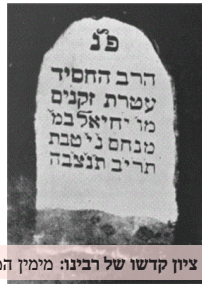
ציון קדשו של רבינו מימין המצבה העתיקה, ומשמאל הציון הקי ששופץ מחדש.