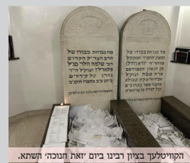
הקוילטען בציון רבינו ביום 'זאת חנוכה' השתא.

לפניו תמונות מרגשות מגווילי הקוילטען, פתקות האזכרה שנשלחו מארץ הקודש אל היכלו הגדול של רבינו בלודמיר, בעצם היום המסוגל יום 'זאת חנוכה' ביום שישי שעבר.