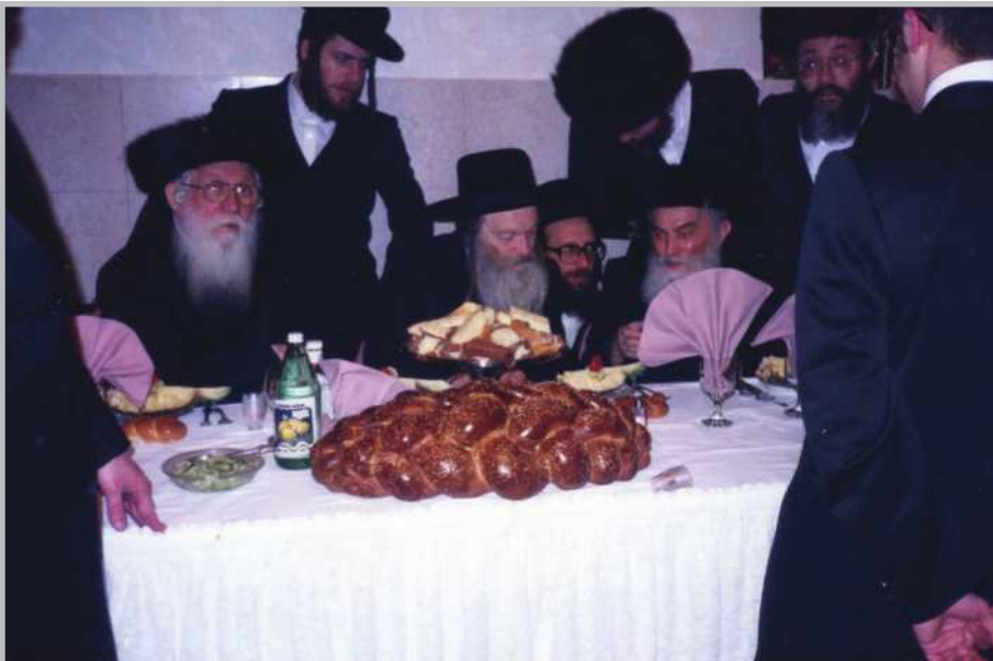
תמונה נוספת באותו מעמד