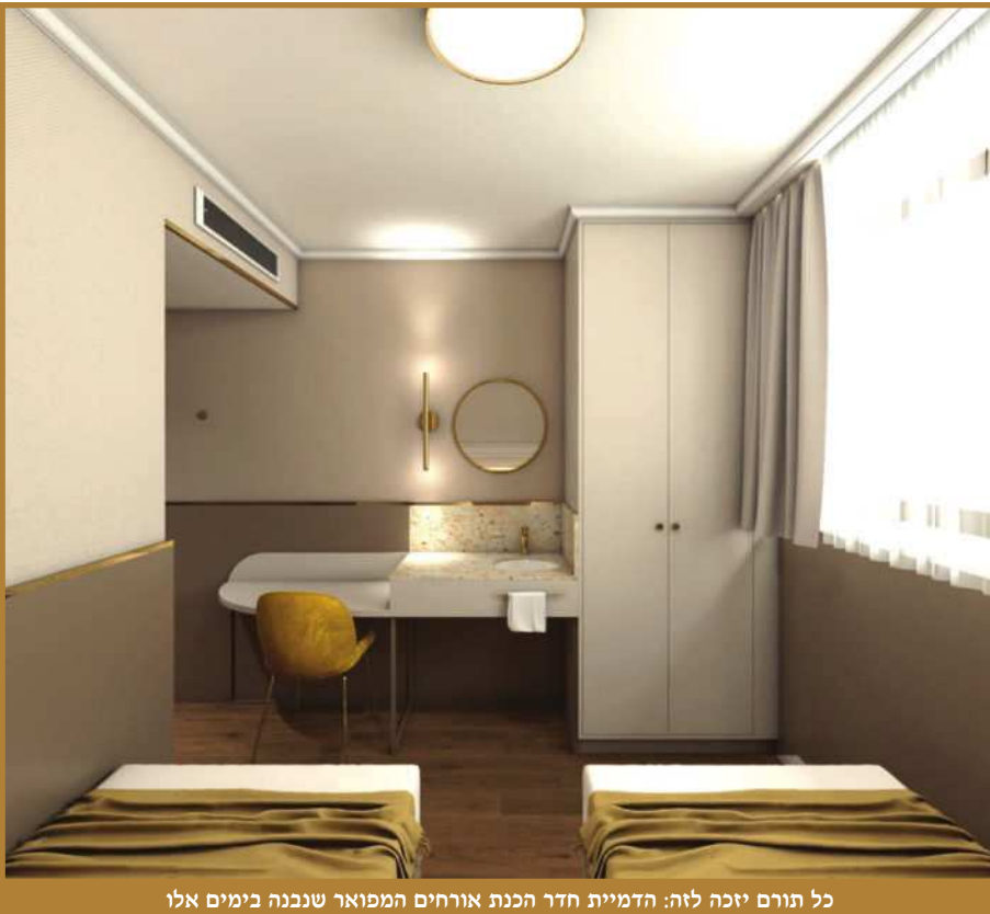
כל תורם יזכה לזה: הדמיית חדר הכנת אורחים המפואר שנבנה בימים אלו