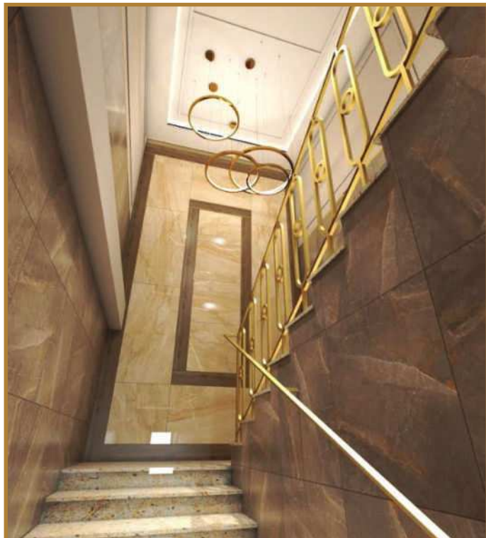
הדמיה המדרגות בבנין הנוכחי לקומה השניה