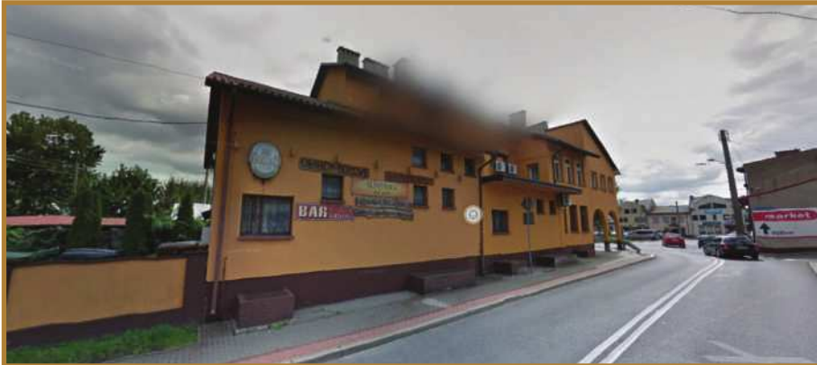
הבנין החדש שנרכש השנה ע"י הכנסת אורחים לעלוב מהחזית השנייה

במקביל לתנופת הבנייה והעבודות בעיירה לעלוב שב"ה בעיצומה: 'הכנסת אורחים לעלוב' רכשה בניין חדש וענק בעיירה כ-800 מ"ר והוא נמצא בהליכי הכשרה לקליטת המוני הבאים להשתטח על ציון רביה"ק הרבי ר' דוד מלעלוב זי"ע ביומא דהילולא ז' שבט כבר השנה