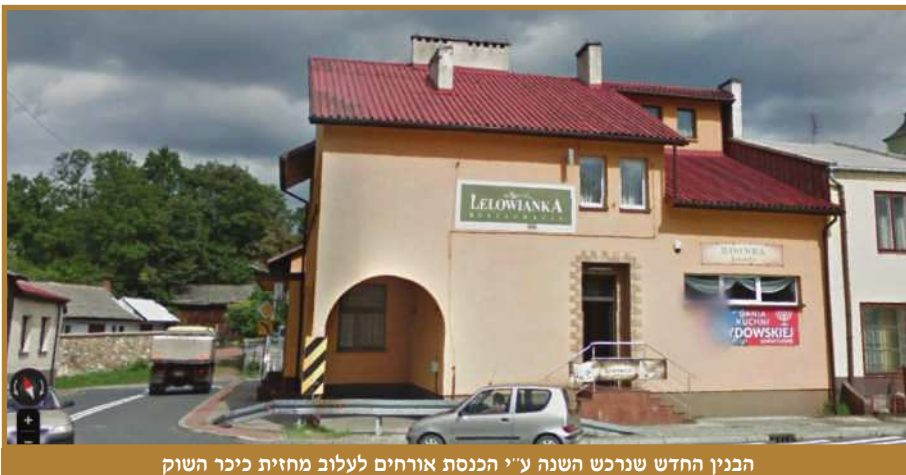
הבנין החדש שנרכש השנה ע"י הכנסת אורחים לעלוב מחזית כיכר השוק