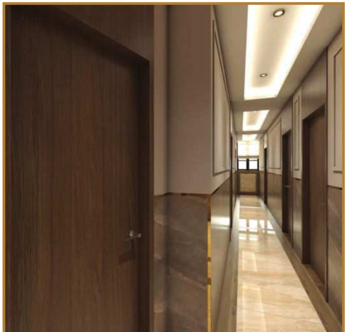
הדמיית פרוזדור החדרים בבנין הנוכחי בו העבודות בעיצומם