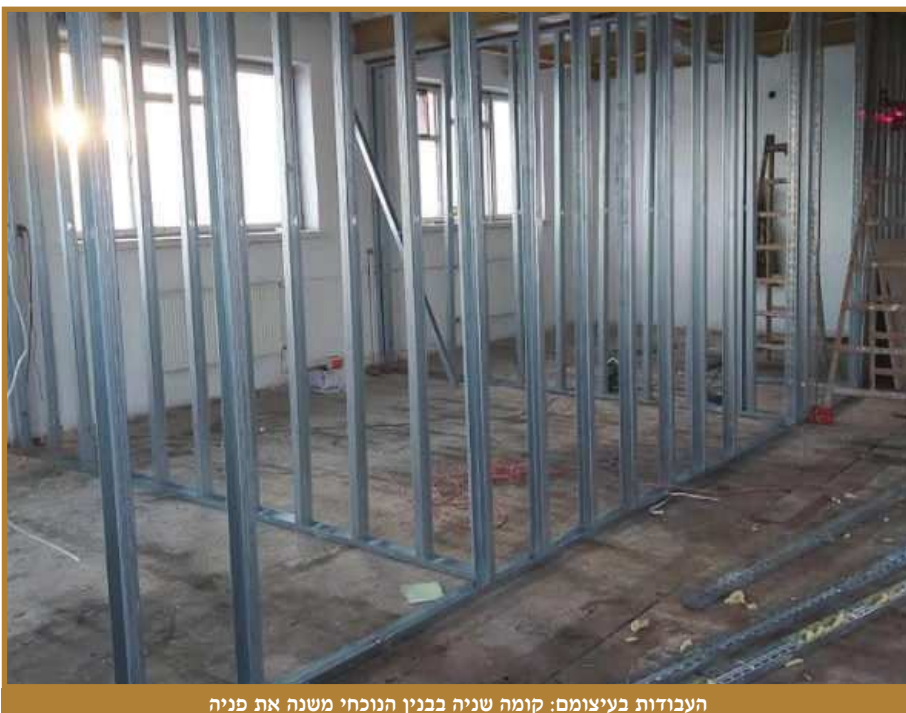
העבודות בעיצומם: קומה שניה בבנין הנוכחי משנה את פניה

השנה האחרונה, מז' שבט תשפ"ג ועד עתה, עברה על קהל עדת חסידי לעלוב בציפייה. מאז ההכרזה ההיסטורית אשתקד, על הקמת בניין ה'הכנסת אורחים' החדש והנחת אבן הפינה שהתקיימה בעיצומו של השנה"ט ביום ההילולא, רוחשת בלב כל אנ"ש הציפייה הדרוכה לראות את התוצאות הברוכות בשטח, בהילולא קדישא הבאה עלינו לטובה.