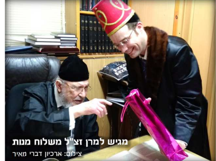
מגישה למרן זצ"ל משלוח מנות

אומר לרבנית: "הצ'ולנט משהו מיוחד!" וכאשר לא היתה רואה - היה לוקח את הבשר ומניחו בצלחת שלי ואומר: "תאכל עוד! אני כבר שבע!"