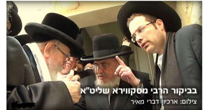
ביקור הרבי מסקווירא שליט"א

כן זכיתי להיות בפגישות עם כ"ק האדמו"ר מסקווירא שליט"א, והייתה להם שיחה כל כך אצילית וכבוד נהגו זה בזה. וכן הוא היה מכבד מאוד את כ"ק מרן האדמו"ר מאמשינוב שליט"א ושחיבבו הרבה בחורה והיו מעריכים זה את זה מאוד [וכמו שראינו בעת ההלוויה ביום שישי זה ש"ק מרן האדמו"ר מאמשינוב שליט"א ליוה את רבינו בדרכו האחרונה במסירות נפש ממש בשמש הקופחת מהלך כשעה וחצי בגלל (הוא ידע 'מלחה' וכו', ואכ"ל)], ובכל עת שרבינו היה רואה אותו מרחוק עובר ברחוב - היה ממתין לו [ופעמים שהיה עובר את הכביש] ואומר לו שלום בהדרת כבוד! וכן זכרתי פעם בבית המדרש בלילה וראיתי ש"ק מרן האדמו"ר מאמשינוב שליט"א מגיע לרבינו והסתגר עמו כשעה ויותר, ועד עכשיו איני יודע מה הם דיברו [כי הגבאים של שניהם היו בחוץ].