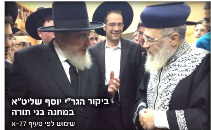
ביקור הגר"י יוסף שליט"א במחנה בני תורה שימוש לפי סעיף 27-א

מנהגו היה שהיה ממעט באכילתו מהחמין שהיתה עושה הרבנית ביום שבת קודש והיה טועם ממנו מעט מאוד ולא היה אוכל הרבה בשני טעמו היה שהוא יוכל אח"כ ללמוד ולא ירדם, והיה