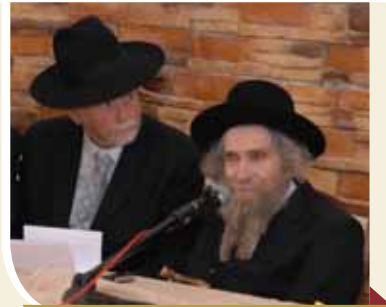
ראש הישיבה הגרא"ל שטיינמן מדבר בכנס 'בני אמונים'

הרב שטיינמן נפטר בכ"ד בבסלו תשע"ח, והוא בן מאה ושלוש שנים. מאות אלפים לאו את מטתו לבית החיים של ישיבת פוניב'ד בבני ברק. חבר את סדרת ספרי 'אילת השחר' על התורה ועל מסכתות הש"ס.