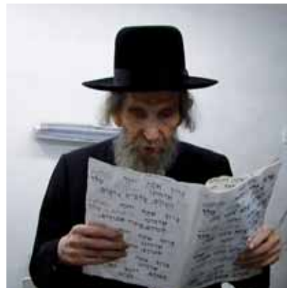
הגרא"ל שטיינמן באמירת ברכות השחר בפני המתפללים

והוסיף: "כשנמצאים בעולם הזה אין מבינים את החשיבות של עניית אמן, שזה שיה מיליארים, אולם בעולם הבא נוכח האדם לראות שכל אמן עוזרת לו, והוא חש בהסרוגה של כל אמן. על האדם לדעת שאפלו אמן אחת יכולה להצילו" (נוטרי אמן ח"ב עמ' 26).