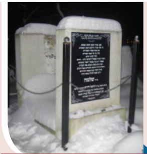
ציון המהרש"ל בבית הקברות הישן בלובלין

המהרש"ל נפטר בי"ב בכסלו של"ד והוא כבן ששים וארבע שנים, ומנוחתו כבוד בבית הקברות הישן בלובלין.