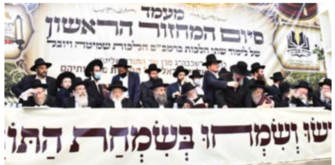
סיום המחזור הראשון של שמיטה ויובל

במעמד סיום לימוד הלכות ושמיטה ויובל שהתקיים על ידי מכון 'שיח אמונה' בשנת השמיטה האחרונה, נשא מרן הגרב"מ זצוק"ל דברים במעמד הרב זצוק"ל, כשבדבריו אמר: "מרן שר התורה שליט"א זיכה אותנו בזכות גדולה מאוד, ללימוד שתי הלכות ברמב"ם שמיטה ויובל בכל יום, זוהי זכות מיוחדת במיוחד בתקופה זו, כאשר מדברים על ה' ועל משיחו, מדברים נגד התורה, עושים את הכל נגד התורה, בונים כל מיני דברים, התריס הגדול ביותר והמלחמה הגדולה ביותר בדבר שהקב"ה שומע הכי הרבה בקולנו כשאנחנו לומדים את תורתו הק' כך שהתקנה הזאת היא תקנה שכוללת כמה וכמה ענינים שלבטח כל אחד ואחד יקבל כל משאלות לבו לטובה, וכל ההלכות האלה יעמדו לעזרנו"