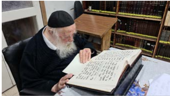
הרב צוקל באמירת תהלים

חד גדיא. יש לפרש ע"פ המדרש (שוחר טוב פ"ו ומובא ג"כ ברש"י זכר"ס פ"ה) למנוצח על השמינית על ד' גליות שהן שמונה מלכיות, בבל כשדים, מדי פרס, יון ומוקדון, ישמעאל ואדום (רש"י העתיק אדום וישמעאל), וכו' אדום וישמעאל על בסדר הדורות שבימי הגאונים כבשו הישמעאלים ירושלים מהרומיים, וזה נקרא ישמעאל נטלו מאדום, והם ימסרו המלוכה למשיח, כמפורש בפדר"א פ"ל ג' מלחמות של מהומה עתידין בני ישמעאל לעשות באחרית הימים ומשיח בן דוד יצמח ע"ש, ועפ"ז יתפרש כל הפיוט וכו' מלאך המות זה ישמעאל כמ"ש (בראשית רבה פמ"ה) והוא יהי פרא אדם שהכל בוזזין ממון והוא בוזז נפשות, ומלכות ישמעאל תמסור המלוכה להקב"ה כמ"ש בפדר"א פ"ל וכו' ל', במהרה בימינו אמן (ועי' בעה"ט סוף חיי שרה).