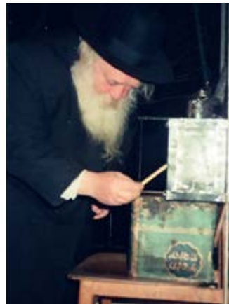
המשך בעמוד 10

שמספרים בניו בין הגוים משמע דשייך פרסומי ניסא בין הגוים {מיהו בשה"צ סי' תרע"ב אות י"ז נראה דבגוים אין פרסומי ניסא וצ"ע}.