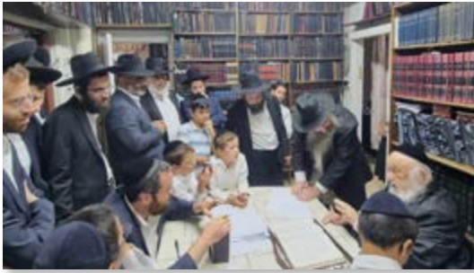
בביתו של מרן ראש הישיבה הגרבי"ד פוברסקי שליט"א