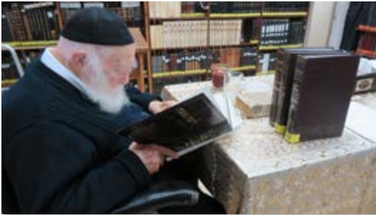
הרב זצוק"ל מעיין בספר 'דעת נוטה'