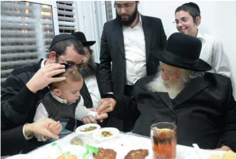
הרב צוק"ל בחלקת דמי חנוכה

הקשו דאם כל א' מבני הבית יהדרו להדליק כל א' נר, הבעה"ב לא יוכל להדר להוסיף כל יום נר, דאין היכר שהוא הוסיף, דהרואה סבור שכך יש בני אדם בבית, ולכן לדעת התוס' ב"ה דאמרי מכאן ואילך מוסיף והולך לא קיימי אלא אנר איש וביתו אז ניכר ההוספה, וא"כ קשה טובא אם הרמב"ם לומד שב"ה קיימי גם אמהדרין נר לכאור"א, ולא איכפ"ל בטענת התוס' שאין ניכר ההוספה, א"כ על מה שמכו אנשי ספרד שהידרו רק להוסיף כל יום ולא הדליקו לכל א' מבני הבית, שזה חצי מדברי בית הלל, וכן הקשו האחרונים ז"ל, עי' לח"מ וב"ח.