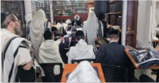
הגרי"ש קניבסקי שליט"א בשיעור לענין מרן החזו"א בבית הרב זצוק"ל