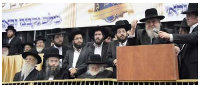
מרן הגרב"מ זצוק"ל נושא דברים באחד המעמדות במעמד הרב זצוק"ל

לאחר הסתלקותו של הרב זצוק"ל , נשא מרן הגרב"מ זצוק"ל דברי מספד, ובדבריו אמר: "אנחנו לא יודעים את גודל האסון שקרה לנו, כמה אנחנו חיינו על חשבוננו. הוא הרי קיים את כל העולם ממש, בוודאי את כולנו. מי יכול להספיד את רבי חיים, אפשר לתאר כמה דברים, אפשר להסביר כמה דברים מכל ההנהגות שלו פה ושם, אבל איך נספידהו, והלא קטני קטנים אנו ליד דמות הענק הזאת".