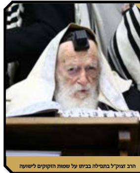
הרב זצוק"ל בתפילה בביתו על שמות הקוקים לישועה

"בנכ"ל דור ודור עומדים עלינו לכלותינו ורקב"ה מצילנו מידם ואין לברור מארץ ישראל"