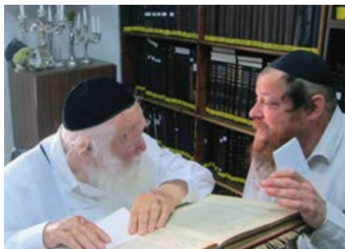
המשך בעמוד 2

ראיתי לנכון להעלות ע"ג הכתב, לאחר פטירתו של הרב זיע"א, מן הדברים אשר שמעתי וראיתי בעיני, אצל מרן הרב זיע"א, ויהיו הדברים לעילוי נשמתו הטהורה.