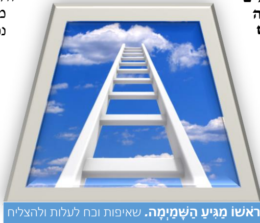
וראשו מגיע השמימה. שאיפות וכח לעלות ולהצליח