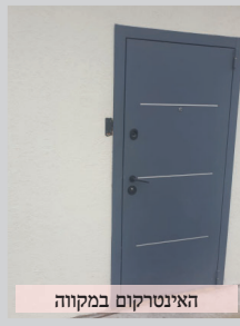
אינטרקום בלתי הראשית