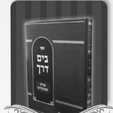
ענייני שבת, מ"ב מאמרים על מעלות השבת וסדר מצוותיה.