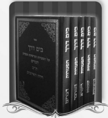
אוצר בלום של מאמרים נפלאים לבאר הפרשה עם ענייני ההפטרות