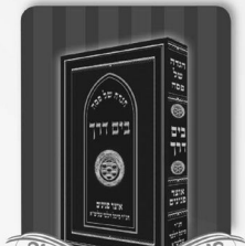
אוצר פנינים על סדר ההגדה משולב עם נוסח ההגדה בהוצאה מארית עינים.

לפרטים והזמנות: 072-2-5401167 . 5401157@gmail.com הפקה ראשית: ספרים שיווק והפצה 3100946@gmail.com