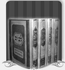
שיעורים ערוכים על כל המסכת מדישא עד גמירא, פסחים, יומא, גיטין, קדושין.