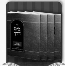
קונטרסי המועדים יחד ראשונים וזמן היתרון ענייני ל"ג בעומר ענייני ימים נראים ענייני תג השואה, ענייני תוכה