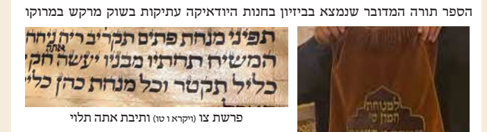
הספר תורה המדובר שנמצא בבזיון בחנות היודאיקה עתיקות בשוק מרקש במרוקו

בפדיונה, ועתה מי יודע אם לעת כזאת אולי יאמרו לגוי שבשביל שהוא מעבד ספרי התורה בידו על כן באה עליו כל הרעה הזאת ואז יבין שחייב להוציא את ספרי התורה מרשותו וליתנם לישראל שניהגו בהם כדינם.