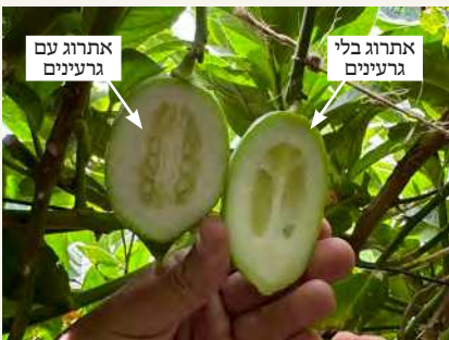
ב' אתרוגים באותו עץ ובאותו ענף אחד עם גרעינים ואחד בלי גרעינים