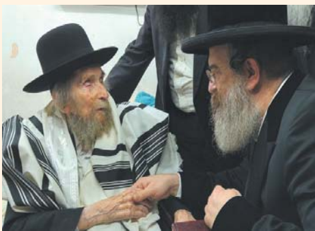
כ"ק האדמו"ר מסאדיגורה רבי ישראל משה פרידמן זצ"ל עם נשיא מועצת גדולי התורה הגאון הרב אהרן יהודה לייב שטיינמן זצ"ל