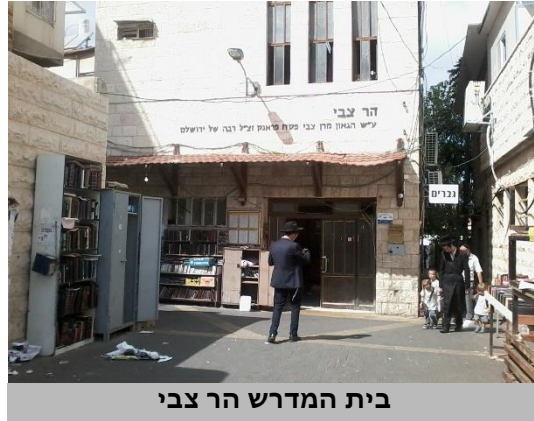
בית המדרש הר צבי