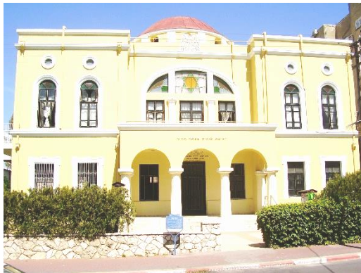
בתמונה: ישיבת לומז'ה

לשם תענוג גרידא, שלא לעבור ולא לדרוך במקומות מועדים ומסוכנים מבחינה רוחנית? נקודה למחשבה.