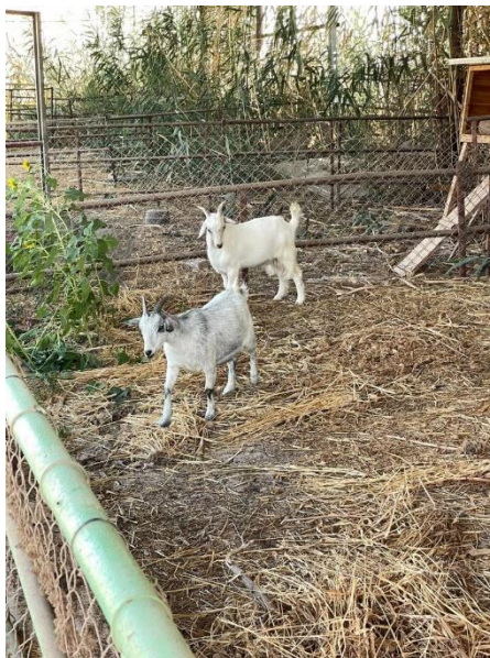
החלמאי לא הבין את ההבדל... בתמונה: תיש ועז בדיר

עם עלות השחר, החלו היהודים לעבור אחד אחד אל תוך חדר הרב, מבקשים ללטף במגעם את ארבעת המינים הקדושים, להחזיק בידיהם את הלולב והאתרוג עם ההדס והערבה. בשמחה עצומה עמדו וברכו 'על נטילת לולב' ו'שהחינו', וכמעט שיצאו בריקוד משותף על הזכות הכבירה... בהתבוננות מעמיקה בסיפור המרגש הזה, המופיע בספר 'טללי אורות', נוכל לגלות את האור הבוקע מחג הסוכות. כי הדבר היחיד שיכול להניע יהודים בעיצומה של התופת לשמחה אמיתית, המנוע היחיד שיכול להוביל יהודים פצועים וניזוקים להתמסר לשמוח בסוכות מסות ליפול ובאתרוגים נדירים, הוא רק השמחה שלהם בבואם, בקשר שלהם עם אביהם שבשמים, בכך שבחג הזה הם מוכיחים את אהבתם אליו בכל נימי נפשם! כי כשיהודי זוכה לקרבת ה' אמיתית, דווקא במצבים קשים הוא קופץ על החיבור שלו עם אביו שבשמים, הוא שש על ההזדמנות לשמוח עם בוראו. ככל שנשמח בחג הזה, ונפנים כי הוא הזמן בו אנו מבטאים מתוך שמחה ואושר את החיבור והקשר שלנו עם אבינו שבשמים, כך באמת נזכה להדק את החיבור שלנו עמו ולהמשיך את הקשר שלנו עמו לכל ימות השנה, מתוך רוב שמחה ואושר! (לקראת שבת מלכתא'-הרב אשר קובלסקי שליט"א)