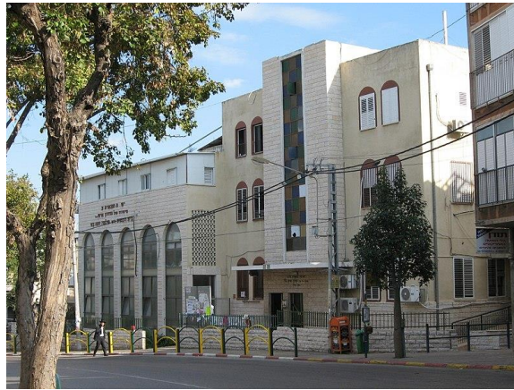
ישיבת תפארת ציון (נצח) בבני ברק

בשנה שעברה כאשר הרשויות הטילו סגרים ומגבלות שונות מחמת מגפת הקורונה, וקשרי התעופה נעשו קשים ומסוככים, לא היתה אפשרות של טיסה ישירה לארץ הקודש, והוכרח להגיע