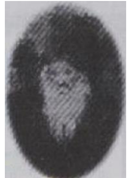
רבי שלמה (הראשון) הלבֶרשטאם מבאבוב

חסרי עמוד שדרה רוחני. אנחנו נאבקים, אבל הוא מנסה בשקט בשקט בלי שנרגיש לקחת את העז ולהחליף אותה בתיש, לקחת את כל מה שרכשנו בימים הנפלאים האלה, וברגע קטן של הסח הדעת, של חוסר שימת לב להפקיע מאתנו הכול, ואנחנו נמצא את עצמנו שוב, בדיוק באותו מקום שבו היינו קודם. התאמצנו להתקדם, השגנו את מה שהשגנו בעמל וברצון טוב, לא ניתן לזה לברוח, לא נפסיד את כל הדברים הטובים שקיבלנו בראש השנה ויום הכיפורים, בשביל רגע אחד של חוסר זהירות. (סיפורים נפלאים)