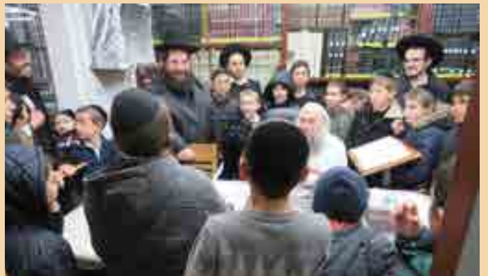
ישיבת המתמידים מבית שמש נכנסו לבית הרב זצוק"ל לבחינה ודברי ברכה ע"י בנו הגר"ש קניבסק שליט"א לקראת הימים הנוראים