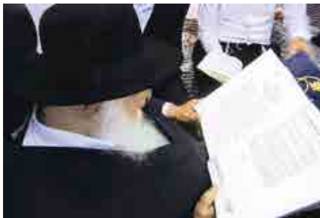
הרב זצ"ל מעניין בספר 'עני אלמונים' של הגר"א זצ"ל, שיצא לאור לאחר פטירתו

אמנם לאחר כמה שנים ראה כמו גדולים דברי חכמים כיון