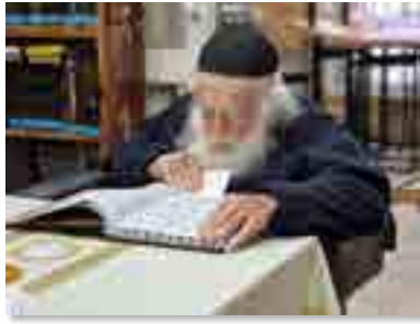
הרב זצוק"ל באמירת התהלים בעשרת ימי תשובה

במיוחד לימי עשרת ימי תשובה: במקביל לחיזוק הגדול בסדרי הלימוד במפעל 'שיח התורה' שנוסד ע"י מכון 'שיח אמונה' לעילוי נשמת הרב זצוק"ל, מכריזים ב'שיח התורה' על חיזוק מיוחד לימי עשרת ימי תשובה הבעל"ט, לצעד בדרכו שהנהגתו של מרן זצוק"ל באמירת כל ספר התהלים מידי יום מימי עשרת ימי תשובה.