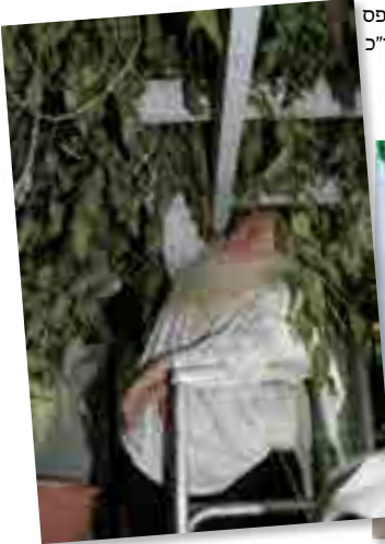
שיח השדה שבת פ"א ב', על רש"י ד"ה האי, ושוב נדפס בטעמא דקרא בענייני יו"ט

לילי צום עד אותו לילה שיצום למחר ואותה הלילה מותר לאכול בשר (והכונה היא לצום יו"ט כמש"כ בר"ן ובתוס' שם עיי"ש). אמנם רש"י בנדרים ידוע שאינו מרש"י אלא מראשון אחר. אמנם במשנה ברורה לכא' יש בזה סתירה דבס"ל תר"ד סק"ב ובשה"צ שם כתב שהנוהג שלא לאכול בשר כי אם בימים שא"א בהם תחנון או אפ"ל בליילה של עיוה"כ מותר לאכול ובמקומות שמרבין בסליחות באשמורת א"כ אין חושבין אותן ליו"ט אין לאכול בשר בליילה מבואר דלמנהגינו כמנהג אשכנז שאין מרבין בסליחות בעיוה"כ הוי יו"ט שם בליילה ומותר לאכול בשר א"כ פסק כרש"י בנדרים אמנם בס"ל קל"א סק"ג פסק דבעיוה"כ אומרים תחנון במנחה שלפניו והיינו