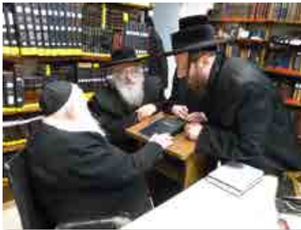
הגרא"א כ"ץ בביקור אצל הרב. שבט תשע"ג, לצידו בנו הגרא"ש שליט"א