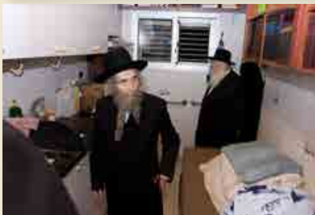
הגראי"ל זצ"ל בנוסחתו לבית ידיו הרב זצ"ל

כלפי מערב ומקרטיגני כלפי מזרח אין מכירין את ישראל ולא את אביהן שבשמים, איתיביה רב שימי בר חייא לרב ממזרח שמש ועד מבואו גדול שמי בגוים ובכל מקום מוקטר מוגש לשמי ומנחה טהורה, אמר ליה שימי את, דקרו ליה אלהא דאלהא (והיינו, שמאמינים בקב"ה, אבל גם בע"ז, וקוראים לקב"ה - 'אלוקי האלוהים'), מבואר בגמ' ששייך שמכירים אבל לא כמו שצריך'.