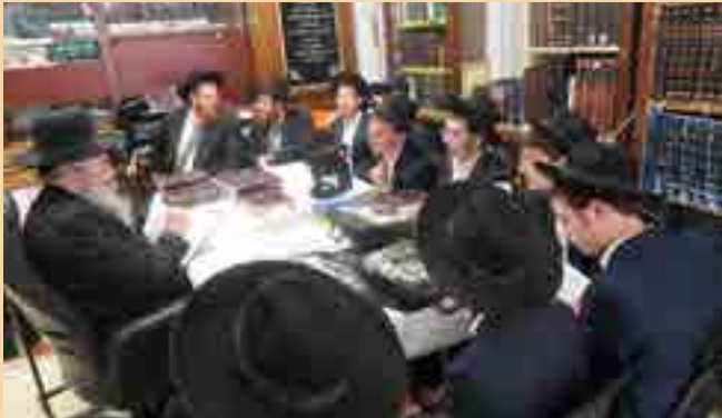
תלמידי ישיבת 'תפארת יונה' מקרית הרצוג הגיעו לבית הרב זצוק"ל וזכו להבחן ולהתברך מפי בנו הגר"ש קניבסקי שליט"א

מראות הוד משולחנו של הרב זצוק"ל בימים אלו