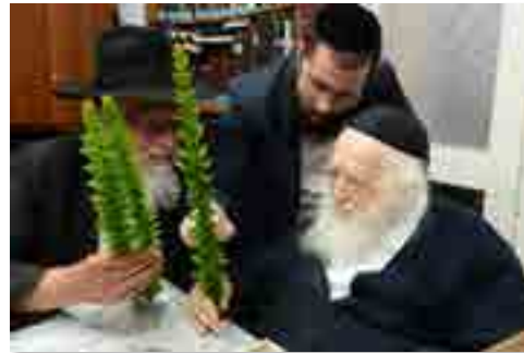
הרב זצ"ל בוחן בקורות רוח הדסים עבור לחג הסוכות.

לשחוט בלילה שהסעודה אינה עד למחר. ומבואר דבליל תשיעי ליכא סעודה שאין מצוה לאכול. אמנם בנדרים ס"ג ב' תנן אמר קונם בשר שאיני טועם עד שיהא הצום אינו אסור אלא עד לילי צום שלא נתכוין זה אלא עד שעה שדרך בני"א לאכול בשר פירש"י עד