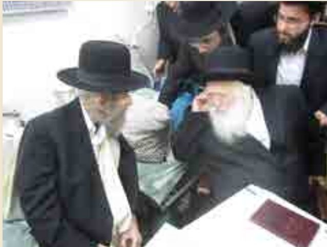
הרב זצ"ל בביקור בבית ידיו הגראי"ל זצ"ל

הרב השיב מיד: 'נו, כבר בגמ' הקשו כעין זה, בסוף מנחות (ק"א א) 'אמר רב מצור ועד קרטיגני מכירין את ישראל ואת אביהם שבשמים, ומצור