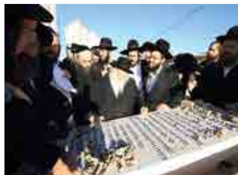
הרב זצ"ל בקברו של הגרא"ג זצ"ל