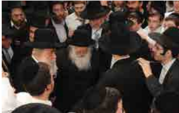
הגר"א זצ"ל בשמחה של מצוה עם הרב זצ"ל

שח הגר"א משה פכטהלט שליט"א, מתלמידיו של הגר"א: 'בהזדמנות מסוימת הוצרך הגר"א לשוחח עם רבינו בענין מסוים, ונתלוות אליו ובהגיענו לשם ראינו תור ארוך של אנשים משתרך לפני בית הגר"ח לבקש את ברכתו, ואני אמרתי לתומי לגר"א, שאני עצמי עושה טובה לרבינו, ואיני עולה לבקש ממנו ברכה כדי לא להטריחו, הגר"א השיב לי בזה הלשון: 'חייך קודמים', והיינו, שחיי המתברך מפיו של גדול הדור, קודמים...'