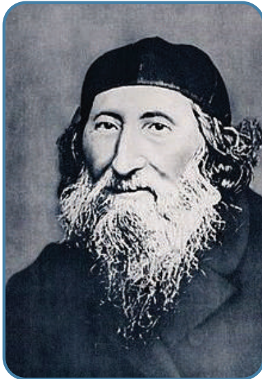
מצאתי תשובה לקושיא החזקה. "הגאון" ר' עקיבא איגר

היה זה לוי מהאריות שבחבורה אברך בר אוריין משכמו ומעלה, שהתקשה בקושיא חמורה, תחילה היה סבור שעם קצת מאמץ יצליח הוא ליישב את הדברים והסוגיא שוב תאיר כנתינתה בהר סיני, אבל לאחר שהתאמץ עוד ועוד בניסיון ליישב את הדברים, הקושיא רק הלכה וגדלה. משראה שכך הם הדברים, פנה לוי למספר חברים גם הם גאוניו מופלגים והציע לפניהם את קושייתו, קיווה כי על ידי חידוד השאלה עם מספר חברים יתלבנו הדברים ותבוא הרווחה, כמו שאמרו חכמים: "שני תלמידי חכמים המחודדים זה לזה בהלכה..."