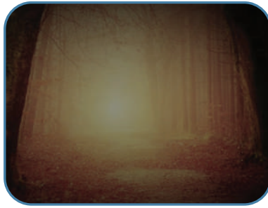
ביער שרר קור מקפיא. התבודדות ביערות

"מצאתי סלע גבוה, נעמדתי עליו ואני מביט לכל הכיוונים תוך כדי שאני אוחז אבן קטנה, מוכן לכל צרה שלא תהיה. בין הדמיונות אני מנסה להוציא כמה מילים של תפילה מהפה, אך לפתע אני שומע פסיעות... ליבי הפסיק לפעום... אני לא רואה כלום... והפסיעות הולכות ומתקרבות. אני לא מבין למה נגזר עלי למות בפעם הראשונה