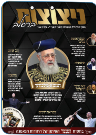
מארז חג מוגדל ומרתק: מגזין ניצוצות תשרי

וכתבה מיוחדת מתאר כיצד צוות 'ניצוצות' יצא