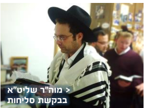
> מה"ר שליט"א בבקשת סליחות

ואם תמצו לומר הסליחות הוא קבלת פני ה' וכמו שאומרים בסליחות "באשמורת הבוקר קראתך אל מהולל" וכו' - שמדברים ישירות אל הקב"ה בבחינת מה שאמר הכתוב (איכה) "שפכי כמים לבך נח פני ה' שאי אליו כפים" וכו', והנה מצאנו בגמרא סנהדרין (מ"ג) לגבי קידוש לבנה ח"ל: "וא"ר אחא בר חיננא א"ר