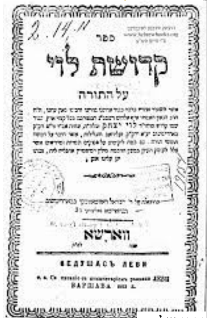
ספרו של רבי יצחק מברדיטשוב

גאוה אל תוך ליבו עובר ב"לא תעשה" של "ולא תביא תועבה אל ביתך", שהרי אין לך תועבה מתועבת כגאוה, ומקרא מלא הוא (משלי ט"ז, ה): "תועבת ה' כל גבה לב". והלא דברים קל וחומר: ומה המכניס גאוה לתוך ביתו כך, המכניס גאוה לתוך ליבו על אחת כמה וכמה (הדברים שנאמרו כאן מבוססים על עלון עבודת ה').