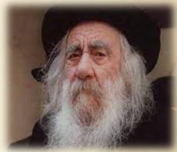
הגאון האדיר רבי יעקב ישראל קניבסקי זצוק"ל