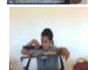
מעמד סיומי המסכתות