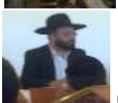
הגאון הגדול הרב אמנון הדס בשיעור