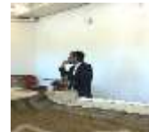
הגרי"ח צמח בשיעור