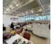
הגרא"ד מדינה בשיעור