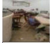
הגרי"מ זביחי בשיעור