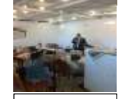
הגרי"א אלמשעלי בשיעור