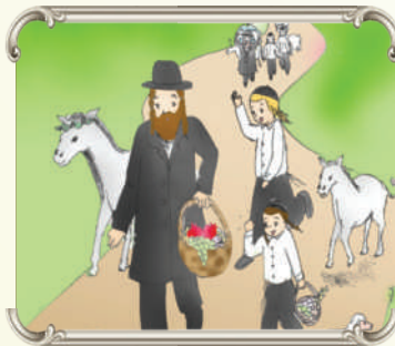
מְבִיאֵי הַבְּכוֹרִים עוֹצְרִים מִמְרוּצַת הַחַיִּים וְעוֹלִים לִירוּשָׁלַיִם וּמְכַרְזִים: 'הַקֶּב"ה טוֹב וּמְטִיב'

מְרַעִיף עָלֵי בְּמַתְנַת חָנָם "כִּי בָאתִי אֶל הָאָרֶץ" - עֲצָם זֶה שְׂאֲנֵי זוֹכָה לְדוֹר בְּאָרֶץ הַקְּדֻשׁ וַיֵּשׁ לִי בֵּית לְגוֹר בּוֹ - אֲנִי שְׂמַח מְאֹד. "וְלָקַח הַכֹּהֵן הַטָּנָא מִיָּד" בְּכַדִּי לְהַנִּיף אוֹתוֹ יַחַד עִם הַבְּעָלִים. הַכֹּהֵן מְלַמֵּד אֶת מְבִיא הַבְּכוֹרִים: תִּתְּבוֹנֵן כְּמָה טוֹב ה' שׁוֹלַח לָךְ מִכָּל הַכּוֹנִינִים, מְלַמְעָלָה יוֹרֵד גֶּשֶׁם, מְלַמְטָה בְּאָרֶץ צוּמְחִים פְּרוֹת נִפְלְאִים, וּמִהַצְּדִידִים יֵשׁ אֶת הַרוּחוֹת הַטּוֹבוֹת שְׂכּוֹלִילִים אֶת כָּל הַשְּׁלִיחִים הַרְבִּים שֶׁה' שׁוֹלַח בְּכַדִּי שֶׁהַשְּׁפַע יְבוֹא אֵלַיךְ. אָדָם שְׂקוּעַ בְּעַצְמוֹ וּבְקִשְׁיִים שִׁישׁ לוֹ וְתִפְקִיד הַכֹּהֵן לְעוֹרֵר אוֹתוֹ לְהַתְּבוֹנֵן כְּמָה ה' נָתַן לוֹ טוֹב. וְזֶה עֵנֶן הַרוּחוֹת שְׂמִסְמִילִים עַל הַרוּחַ הַטּוֹבָה, רוּחַ שֶׁל שְׁלוֹה וְשִׂמְחָה. כְּאֲשֶׁר אָדָם רוֹאֶה טוֹב תְּמִיד הוּא יִהְיֶה מְאֻשֶׁר, מְאִידָךְ, כְּאֲשֶׁר אָדָם לֹא רוֹאֶה אֶת כָּל הַטּוֹב שֶׁהוּא מְקַיֵּף בּוֹ תְּמִיד יִהְיֶה לוֹ טְעוּנוֹת. בַּל נַחֲיָה כְּמוֹ הַיִּלְדִים הַקְּטַנִּים שֶׁכְּאֲשֶׁר חָסַר לָהֶם דְּבַר מְסִים, לְמֵרוֹת שֶׁהוּא קִטָּן מְאֹד שׁוֹם דְּבַר לֹא שׁוֹה בְּעֵינֵיהֶם וְהֵם מְרַגִּשִׁים שְׂאִין לָהֶם כְּלוּם.