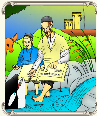
על האדם להוציא מלמודו יראת שמים והערכה לבורא, וללכת בדרךיו שכלם חן וחסד ורחמים...

כמה נוראים דברי החפץ חיים, שעתידי אדם לתן דין וחשבון על שלא ערך בכל יום חשבון נפש עם עצמו בעולם הזה; הבה נקדיש בכל יום