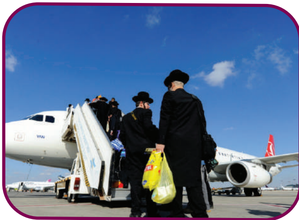
פרויקט שיביא המונים: חסידי ברסלב בעלייה למטוס בדרכם לאומן

למען ריבוי הבתים לקיבוץ הקדוש ראש השנה תשפ"ד, הארגון מסבסד סכום של $300 דולר לכרטיס טיסה למי שלא היה אף פעם באומן בראש השנה, הסיבסוד נעשה במשרדי הנסיעות 'ריבוב' ו'נתיבים טורס' וכך לראשונה יזכו להגיע לראש השנה מאות אנשים שלא היו באומן מימיהם.