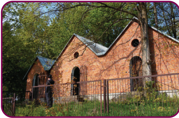
"אנא פתח ליבי בתורה הקדושה" קברו של הרה"ק מפשיסחא

הילד שמחה בונם ישב בשקט, מכוונס בתוך עצמו ואינו מבין דבר. אמנם, ניסה והתאמץ מאד להבין, הקטיב לדברי המלמד, ניסה לשנן את דבריו שוב ושוב בראשו, לנסות להבנים, אבל מוחו - אטום, סתום וחתום, כאבן חזקה שקשה לבקיעה. המעט, שכן הצליח להבין היה שפת הארמית, וגם זה טיפין טיפין, אבל כשהיה המלמד נכנס לסברות הגמרא, כאן כבר לא היה יכול מוחו לסבול את הדברים, ולא היה מבין דבר. מצטער היה שמחה בונם על כך, מתאמץ ומנסה להבין, אבל ללא הואיל.