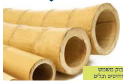
עין המבטוי משמש לתענוגות הימים וכלים