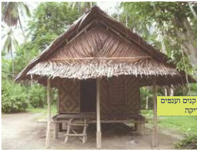
בקות עץ עשויות קנים וענפים מיני באפריקה