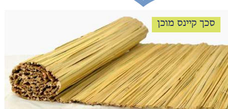
סכך קיינס מוכן

סברא נוספת לאסור מדינא, על פי שיטת המאירי (סוכה דף ט:), שגם כלי העשוי לבנין ולמחיצה נקרא מקבל טומאה. והרי המציאות משתמשים במחצלות למחיצות וכדומה, וכן באפריקה משתמשים עם זה לבנין בתים ובקתות מקנים ועצים, ובפרט מעצי במבוק שהם קשיחים ונוחים, ואם כן מקבל טומאה (ראה בתמונות המצורפות בקתות וגדרות מקנים).