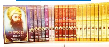
Une partie des livres du rav

Le Ben Ich 'hai 10 dit que le jour d'un yartzeit n'est pas limité. Même si un fils vit 100 ans après la mort du père ou de la mère, il doit faire le yartzeit tout au long de sa vie, en disant le kadich , en allumant une bougie, en donnant la tsédaka et en apprenant selon ses capacités. C'est parce que même si le proche défunt a été sauvé de la punition et entre au Gan Eden 11 , l'âme du défunt n'acquiert pas l'ascension complète à un moment donné. Au contraire, elle monte de niveaux à différents moments. Il y a une âme qui, même jusqu'à 1000 ans, n'atteindra pas tous les niveaux qui lui sont accessibles. L'âme monte au fil des ans, ascension après ascension jusqu'à atteindre son « zénith ». Selon le 'Hatam Sofer 12 , il n'y a pas de point final. Au contraire, l'âme peut continuer à monter, comme il écrit ושו בו יארצייט מעיינים בדינו ומתעלה וכן לעולם.