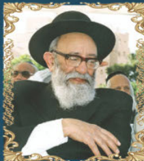
הרב יוסף קאנאח י"ח תמוז תש"ס (2000) חבר בית הדין הרבני הגדול ומנהיגים של יהודי תימן בארץ ישראל