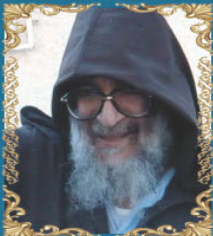
הרב אלעזר אבונחצירא כ"ז תמוז תשע"א (2011) "בבא אלעזר" בנו של רבי מאיר אבונחצירא ונכדו של הבבא סאלי