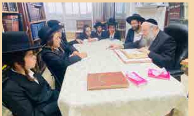
תלמידי ת"ת 'היכל התורה' ברסלב מצפת הגיעו לבית הרב זצוק"ל לבחינה ושמיעת דברי ברכה מפי בנו הגר"ש קניבסקי שליט"א