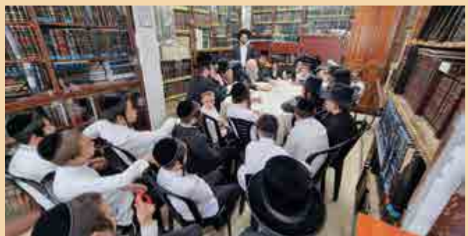
תלמידי ת"ת שטפשוט מאלעד הגיעו לבית הרב זצוק"ל לבחינה ושמיעת דברי ברכה מפי בנו הגר"ש קניבסקי שליט"א