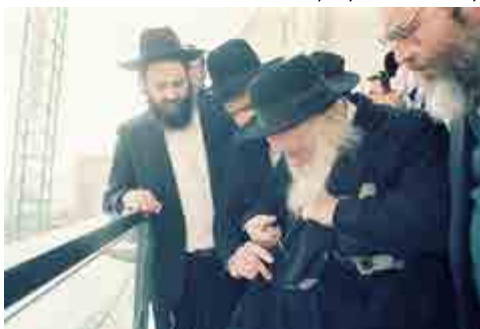
רבינו סמוך ונראה למתל המערבי בשעת הקריעה. לצידו גיסו הגר"י שליט"א

ויתכן שהטעם שאין מצוה לבקר בהמותיו בזמן הזה, הוא משום שהביקור אינו מעכב, והוא רק למצוה, אמנם כתוב במסכת סוכה (דף מב ע"א) 'ר' יוסי אומר השוחט את התמיד שאינו מבוקר כהלכתו בשבת חייב חטאת, ויביא תמיד אחר' ומשמע מהתוס' שם (ד"ה שאינו מבוקר) שהוא מעכב בדיעבד, אולם בשו"ת תורת חסד (סימן כג) ובטורי אבן משמע שביקור ד' ימים אינו מעכב, ולכן כשמשיח יבא יספיק בקור יום אחד שלפני שחיטת הקרבן.