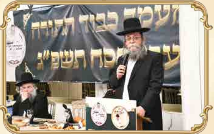
מסיימי המחזור הראשון בסיום הש"ס בסדר 'בדרוכו' של מרון וצוק"ל 8 דפים ככל יום בריקוד של מצוה