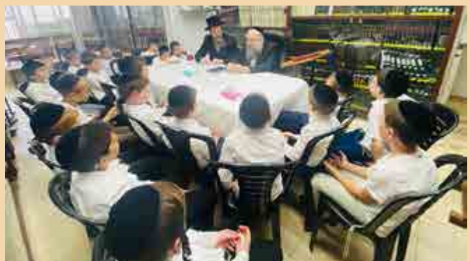
תלמידי ת"ת 'זכרון מאיר' מחיפה הגיעו לבית הרב זצוק"ל לבחינה ושמיעת דברי ברכה מפי בנו הגר"ש קניבסקי שליט"א