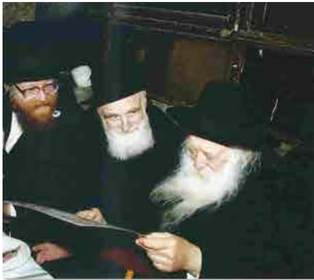
הרב זצ"ל עם ידידו הגר"י פלק זצוק"ל

והנה בגמ' בברכות ס"ב ב' עה"פ ויקם דוד ויכרות את כנף המעיל אשר לשאול בלט (שמואל א' כ"ד ד) אמר ר' יוסי בר' חנינא כל המבזה את הבגדים סוף אינו נהנה מהם, שנא' והמלך דוד זקן בא בימים, ויכסוהו בבגדים ולא יחם לו (מלכים א' א' א'), ולמדנו מזה [עיין משנת ר' אהרן ח"א עמו' נ"ד] שכשאדם מבזה דבר אין לו את הזכות ליהנות ממנו, ומאחר ומזה טובה מרובה, נלמד מזה שאם אדם מכבד דבר, זה מעורר לו זכויות שיוכל יותר ליהנות ממנו, וכמ"ש במשנה באבות פ"ד סוף משנה א' איזהו מכובד המכבד את הבריות שנא' (שמואל א' ב' ל') כי מכבדי אכבד, וכ"כ הביה"ל בסוף ס' קמ"ו על הנוהר בשמיעת קריאת התורה וז"ל אשרי מי שנותן כבוד לתורה וכמו שנא' כי מכבדי אכבד עכ"ל [ולהיפך מי שאינו נוהר בכבוד הספרים יחוש שלא יתקיים בו סיפ' דקרא ובוזי יקלו וכמ"ש הביה"ל בס' פ"ג סעי' ה' סוד"ה אין], וע"ע באבות פ"ד מ"ו ובפיה"מ להרמב"ם שם, ויתכן שזה היה ג"כ א' מהגורמים אצל רבינו שזכה לידיעת התורה המופלגת ולקדושת התורה, ושו"ר בספר מנוחה וקדושה שם באות י"ז שכתב וז"ל ואם תהיו חרדים על כבוד התורה, גם היא תחרד לקראתכם להאציל עליכם מקדושת אור נשמתה למלאות לבכם באהבתה, ופתאום יבא אל היכלו [הוא לבכם] האדון אשר אתם מבקשים, ומלאך הברית אשר אתם חפצים [מלאכי ג' א'] עכ"ל.