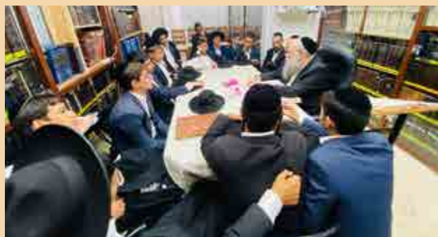
תלמידי ת"ת 'כח התורה' מקרית הרצוג הגיעו לבית הרב זצוק"ל לבחינה ושמיעת דברי ברכה מפי בנו הגר"ש קניבסקי שליט"א