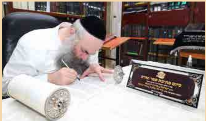
ראשי חצר הקודש דאראג הגיעו לבית הרב זצ"ל למעמד סיום כתיבת האותיות ע"י בנו הגר"ש קניבסקי שליט"א בספר התורה החדש שמוכנס לבית המדרש דאראג