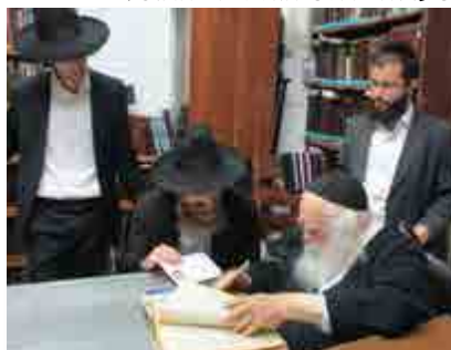
הגר"י פלק במענו של הרב זצוק"ל

זכורני שיהודי א' שאל את רבינו במכתב על איזה ענין רפואי האם לחוש בזה לדעת הרופאים, ורבינו השיב לו: 'ענין תוס' ב"ק פ"ה א' ד"ה עבר', וסיקרן אותי לדעת האם תוס' כבר דנים על אותו מצב רפואי, ועיינתי שם וראיתי שהגמ' דנה בענין תשלומי ריפוי של חובל בחבירו בציר שהנחבל לא שמע בקול הרופאים, וכתבו התוס' עבר על דברי הרופא, לא חשיב לי' פושע כ"כ, ואמנם כנראה שרבינו אחז שבאותו נושא אי"צ לחוש לדברי הרופאים, ואין ללמוד מסיפור זה למקרים אחרים, אבל מה שכן יש ללמוד מזה, שגם כשעוסקים במילי דעלמא, מה שעולה בראש הוא דברי התוס'.