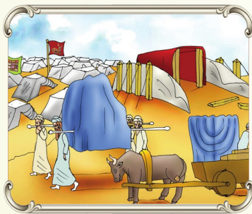
בכדי להגיע לארץ ישראל - לקדשה - צריכה להתעלות ממסע למסע ומנפסיון לנפסיון...

כאשר אדם טועה לחשב שהוא יחיה כאן לנצח הוא עומד על שלו בכל דבר, אולם כאשר אדם מבין שהוא בסך הכל ארץ, גם אם קשה לו עם השכן או עם החבר הוא יודע לומר וגם אם חלילה אדם נכשל בנפסיון הוא לא נפל ברוחו אלא מתכווץ לנפסיון הבא ועומד בו.