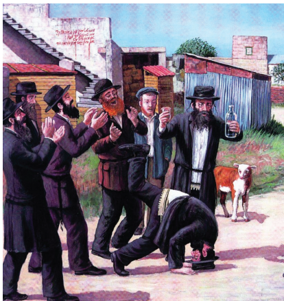
איור: יצחק קליימן ז"ל

עצות והיגדים על מצוות קריאת "שניים מקרא ואחד תרגום"